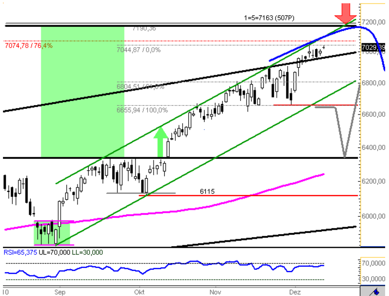
Chart erstellt mit GodmodeCharting