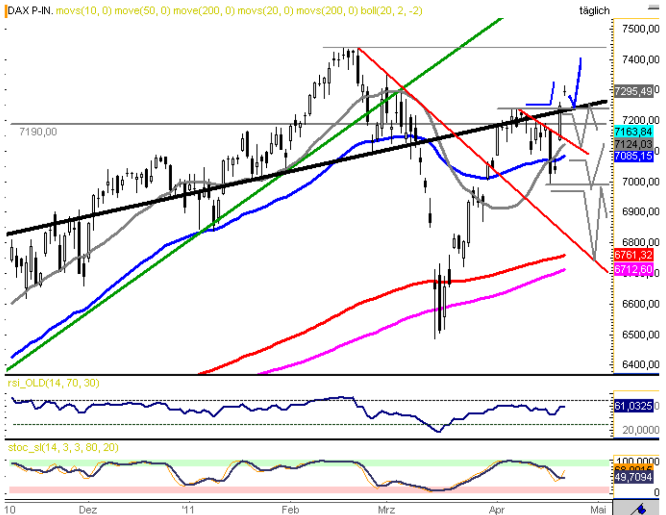
Chart erstellt mit GodmodeCharting

Skizzierung BLAU = bevorzugtes Szenario Skizzierung GRAU = Alternativszenario