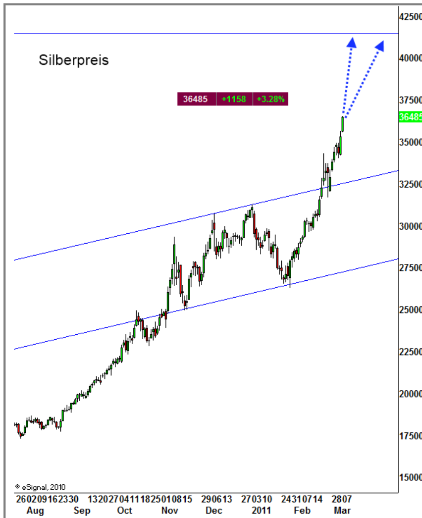
(C,SI #F - SILVER,W) Dynamic,0:00-24:00