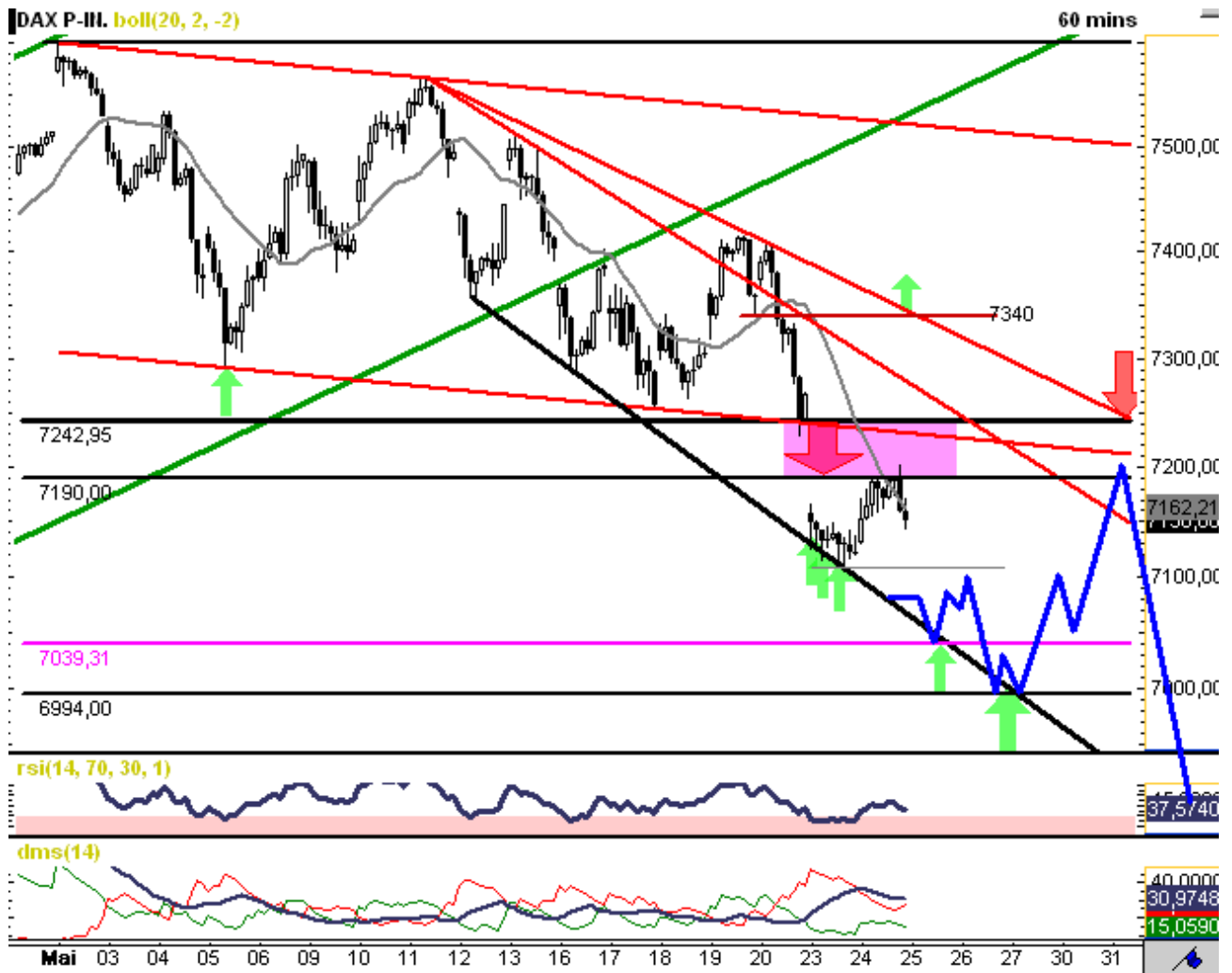
Chart erstellt mit GodmodeCharting

Skizzierung BLAU = bevorzugtes Szenario Skizzierung GRAU = Alternativszenario