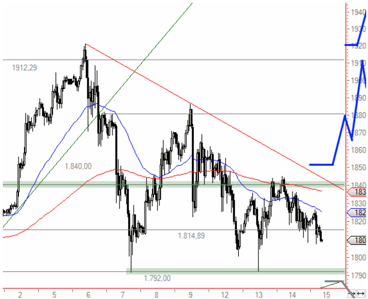
Kursverlauf vom 24.04.2011 bis 15.09.2011 (log. Kerzenchartdarstellung/ 1 Kerze = 1 Tag)