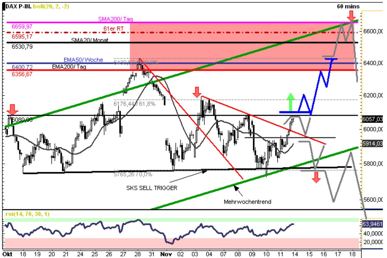
Chart erstellt mit GodmodeCharting

Skizzierung BLAU = bevorzugtes Szenario Skizzierung GRAU = Alternativszenario