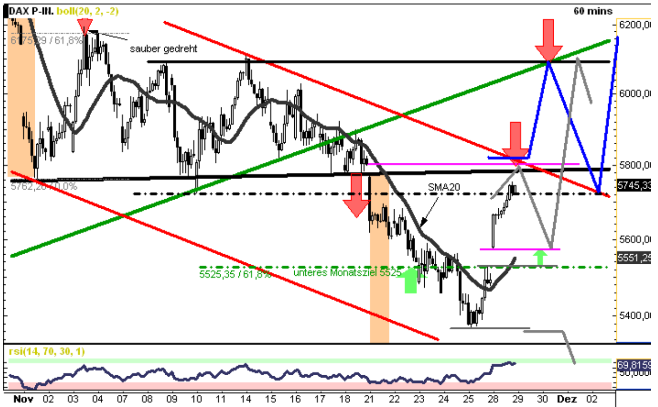
Chart erstellt mit GodmodeCharting

Skizzierung BLAU = bevorzugtes Szenario Skizzierung GRAU = Alternativszenario