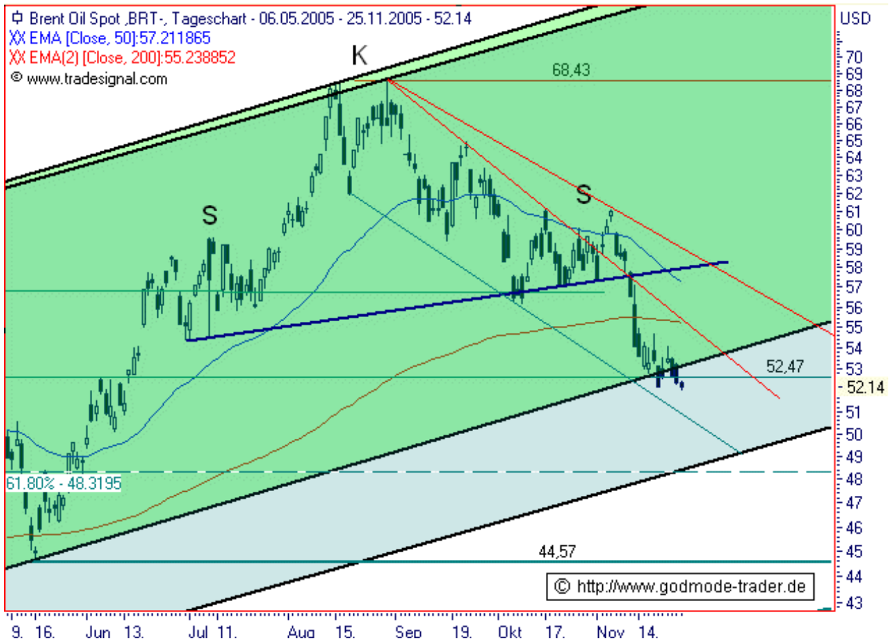
Chart erstellt mit Tradesignal