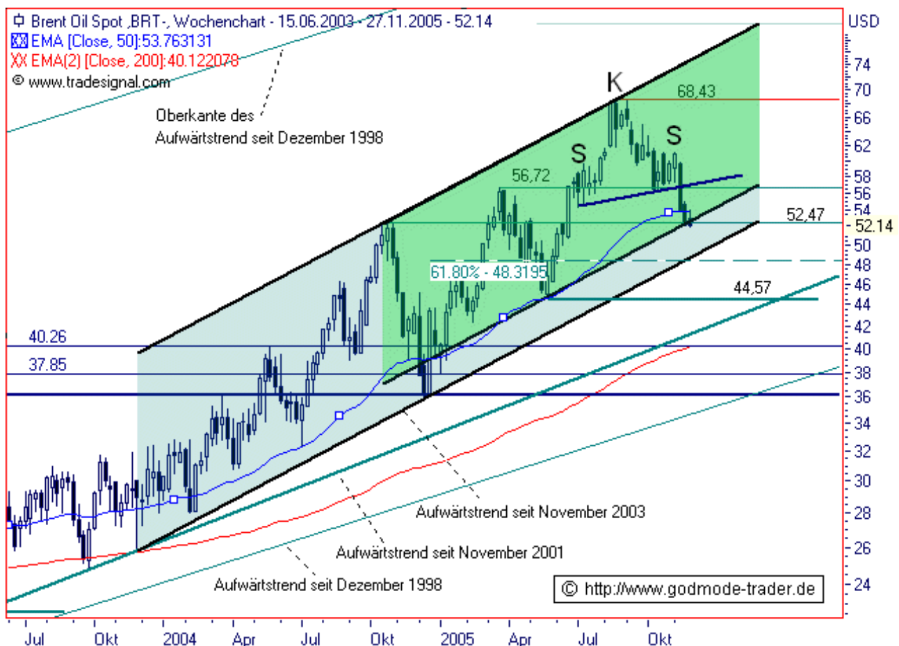
Chart erstellt mit Tradesignal

Diagnose: In der charttechnischen Analyse vom 26.08.05 konnten wir das Bewegungshoch bei 68,00-70,00 $ als solches identifizieren. Als Mindest-Korrekturziel wurde die Marke von 56,72 $ angegeben. Als Maximal-Korrekturziel wurden 50,79 $ angegeben. Seit 2 Wochen notiert Brent Öl im Bereich einer Unterstützung bei 52,47 $. Mit dieser Analyse nehmen wir eine Justierung der bisher getätigten Korrekturziele vor. Die Korrektur wird voraussichtlich weiter verlaufen als 50,00 $. Seit Dezember 1998 befindet sich Brent Öl in einer übergeordneten Aufwärtsbewegung. Seit November 2001 liegt eine klar definierte intakte Aufwärtstrendlinie vor, die aktuell bei 41,30 $ verläuft. Der Aufwärtstrend wäre also auch dann noch intakt, wenn das schwarze Gold bis in den 41,00er $ Bereich fallen würde. Innerhalb der übergeordneten Aufwärtsbewegung hat sich seit Juli 2005 eine bärische SKS Trendwendeformation ausgebildet. Durch den Bruch der 65,72er $ Marke wurde sie ausgelöst. Das charttechnische Kursziel, das sich aus ihr ableiten läßt, liegt im 46,00er $ Bereich. Die 52,47er $ Marke stellt eine starke Kreuzunterstützung dar; sie definiert sich über eine nach unten projizierte mittelfristige Aufwärtstrendlinie und eine horizontale Trendlinie. Ihr Bruch bedeutet einen Folge-Kursverfall bis 48,32 $, wo eine weitere Kreuzunterstützung liegt. Zu nennen, ist ein horizontale Unterstützung bei 44,57 $, in deren Bereich Brent Öl für uns ein mehrwöchiges "Must Trading Buy" wäre.