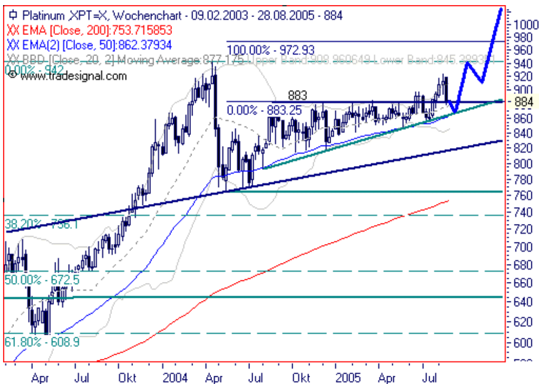
Chart erstellt mit Tradesignal

(Nacktenlinie) bei 845 $ aus. Hier sieht man wieder einmal, dass sich seitens der Charttechnik Kurszielmarken recht gut sondieren lassen. Aus dem Doppelboden ergibt sich ein Kursziel von 940 $. Zeitziele lassen sich hingegen deutlich schwieriger herleiten. Die regelkonforme Auflösung des Doppelbodens aus 2004 zieht sich über ein Jahr hin; und zwar in Form eines langgestreckten steigenden bullischen Dreiecks, welches wiederum eine BUY Triggerlinie bei 883 $ hat. Seit Juni dieses Jahres gab es 2 Ausbruchversuche über diese Triggerlinie. Solche vorzeitigen Ausbrüche sind typisch für langgezogene Dreiecke. Kurzfristig kann Platin bis 860 $ gehen, dann dürften die Notierungen spätestens wieder anziehen. Die mehrfach genannten charttechnischen Kursziele für Platin liegen bei 940 und 1.060-1.080 $.