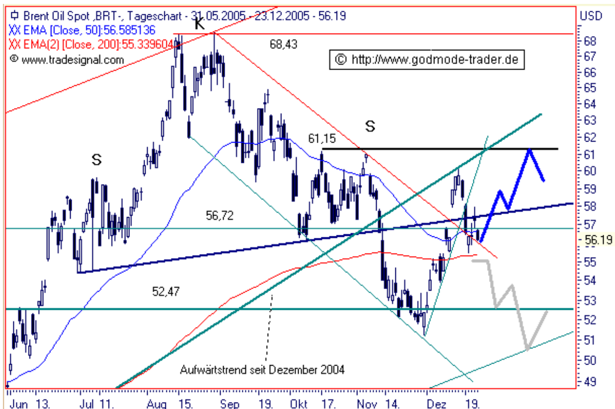
Chart erstellt mit Tradesignal

Diagnose/Prognose: Brent konnte sich seit Anfang Dezember stark erholen und scheiterte im kurzfristigen Hoch an der bei 61,00 $ liegenden gebrochenen Aufwärtstrendlinie seit Dezember 2004. Der Kursverlauf kippte wieder ab und konnte sich auf der bei 55,34 $ liegenden exp.GDL 200 (rot) stabilisieren. Darüber ist noch eine Seitwärtsbewegung möglich, bevor die Ausbruchsbewegung aus dem mittelfristigen Abwärtstrend in Richtung 61,15 $ fortgesetzt werden sollte. Kippt Brent allerdings unter 55,34 $ auf Schlussbasis ab, sind weiter fallende Notierungen in Richtung 52,47-50,00 $ wahrscheinlich.