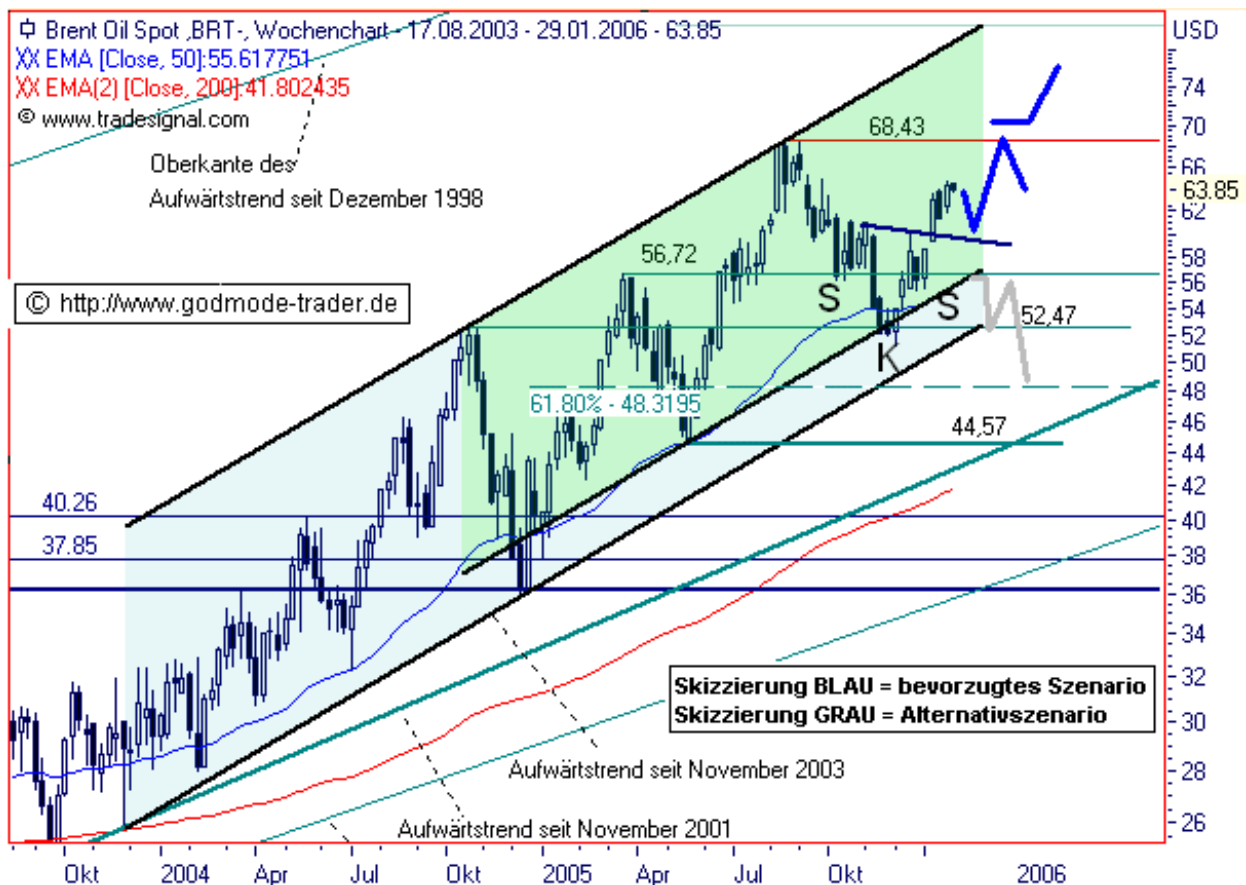
Chart erstellt mit Tradesignal

Diagnose/Prognose: Übergeordnet befindet sich der Ölpreis Brent in einer stabilen Aufwärtsbewegung. Innerhalb eines breiten Aufwärtstrendkanals stieg der Kursverlauf bis September 2005 auf ein Hoch bei 68,43 $ an und ging dann in eine Konsolidierung über. Nach einem leichten Bruch der wichtigen bei 52,47 $ liegenden Unterstützung konnte der Anstieg dann ab Anfang Dezember wieder aufgenommen werden. Während der Konsolidierung bietet Brent eine inverse und damit bullische SKS-Trendwendeformation auf der Unterstützung bei 52,47 $ aus. Diese wurde mit dem Anstieg über eine aktuell bei 59,80 $ liegende Triggerlinie (blau) aufgelöst und lässt weiter steigende Notierungen bis in den Bereich 68,43 $ mittelfristig erwarten. Ein Rückfall auf die Triggerlinie, was zur Bestätigung des Szenarios nicht negativ zu werten wäre, kann aber noch einkalkuliert werden. Das bullische Setup gerät erst bei einem Rückfall unter eine bei 56,00 $ reichende Unterstützungszone auf Wochenschlussbasis in Gefahr. Wenn Brent während einer Fortsetzung der Aufwärtsbewegung auch 68,43 $ klar auf Wochenschlussbasis überwinden kann, sind weitere Gewinne bis in den Bereich 76,00 $ möglich.