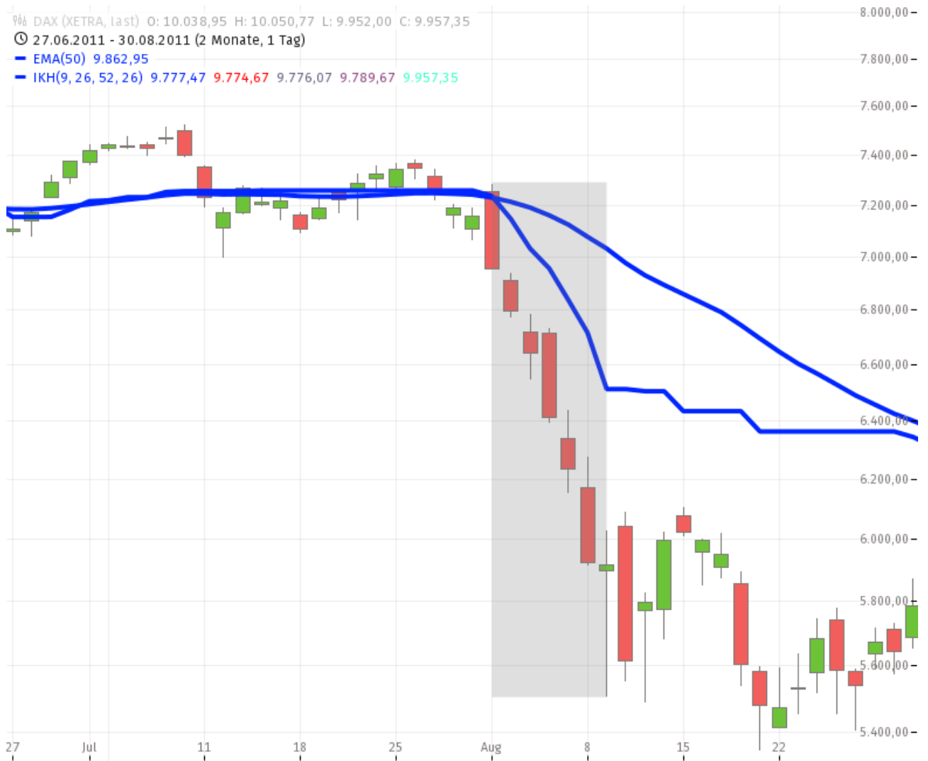
DAX August 2011 (7280 > 5500 in nur 7 Handelstagen)