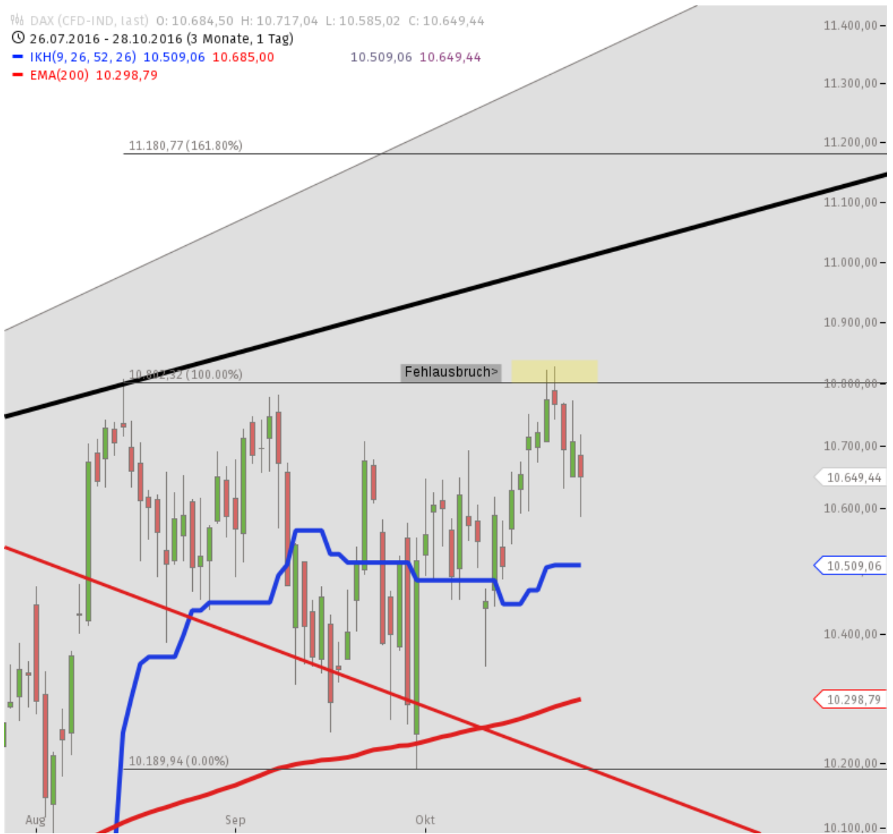
DAX Tag PRO

%% DAX (CFD-IND, last) O: 10.684,50 H: 10.717,04 L: 10.585,02 C: 10.649,44 Ⓞ 26.07.2016 - 28.10.2016 (3 Monate, 1 Tag) — IKH(9, 26, 52, 26) 10.509,06 10.685,00 10.509,06 10.649,44 — EMA(200) 10.298,79