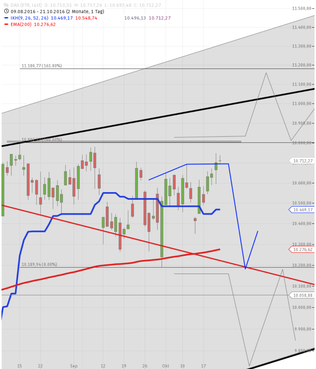
DAX TAG PRO