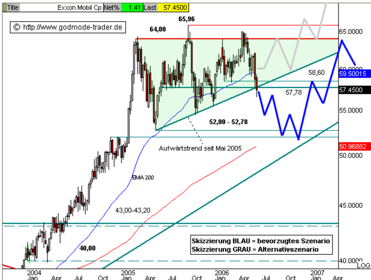
Chart erstellt mit Qcharts

Marke fallen. Die mittelfristigen Abwärtsziele liegen bei 52,00 – 52,78 $ und am EMA200 bei aktuell 50,97 $.