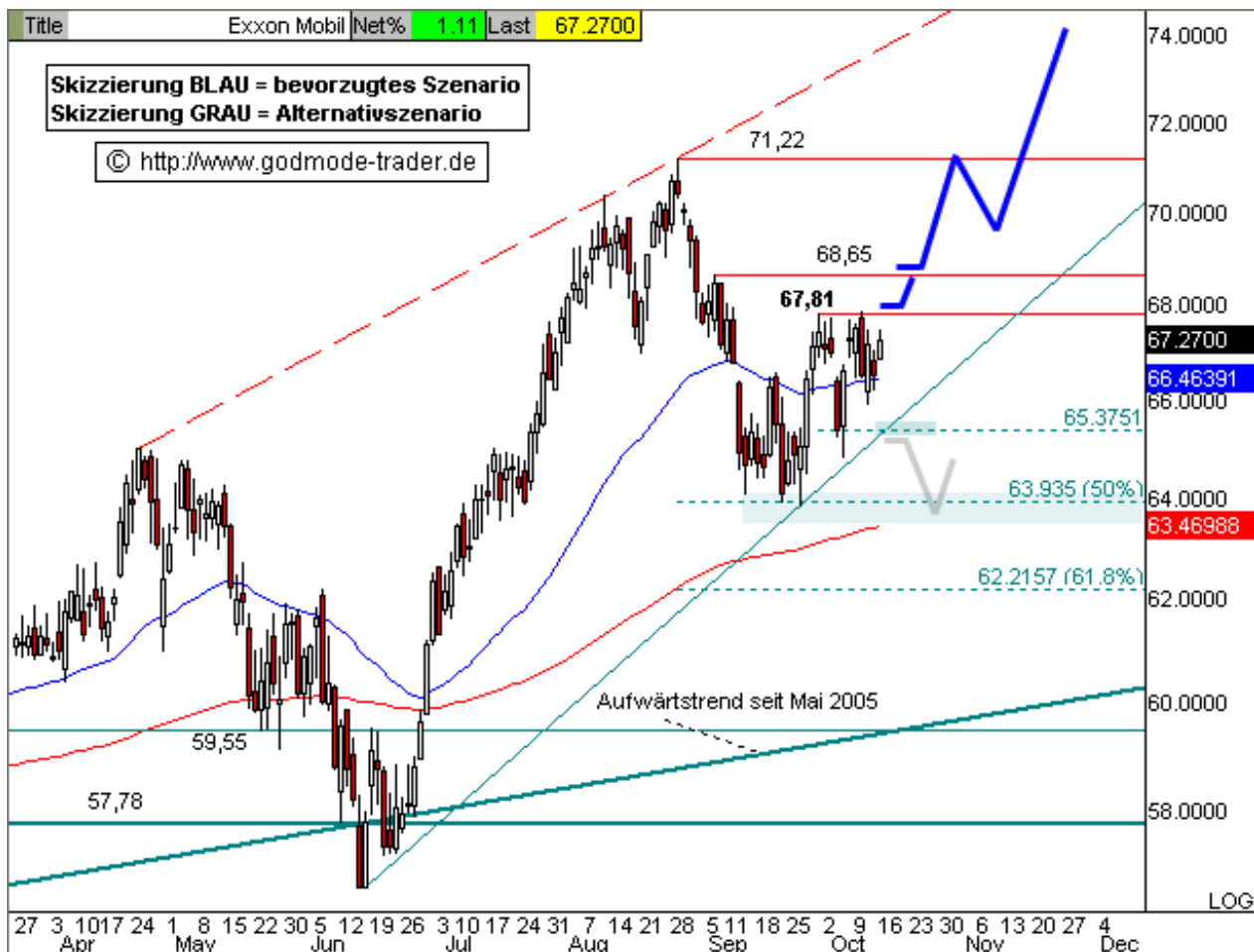
Chart erstellt mit Qcharts

Kurz-Kommentierung: Die EXXON Aktie korrigierte in den vergangenen Tagen nochmals sehr tief, fiel aber nicht signifikant unter 65,00 $ zurück und verhinderte damit ein Verkaufssignal. Die 67,81 $ Marke hat sich als kurzfristiger Widerstand und BUY Trigger herauskristallisiert. Steigt die Aktie jetzt per Tagesschluss über 67,81 $ an, wird ein kurzfristiges Kaufsignal mit Zielen bei 68,85 und 71,22 $ ausgelöst. Fällt die Aktie hingegen per Tagesschluss unter 65,30 $ zurück, werden nochmals Abgaben 63,47 - 63,94 und ggf. 62,22 $ wahrscheinlich.