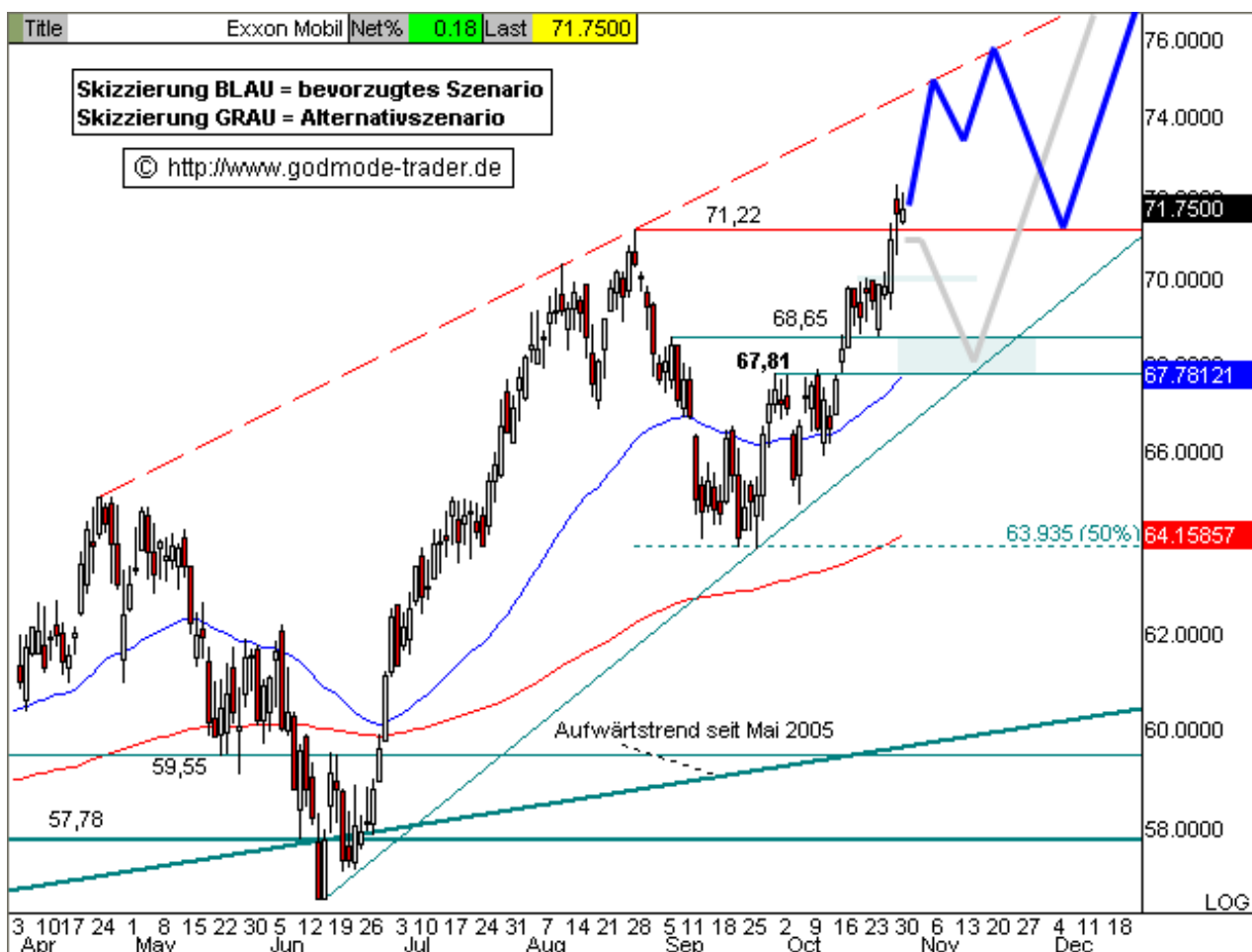
Chart erstellt mit Qcharts

Kurz-Kommentierung: Die EXXON Aktie konnte in den letzten Tagen wieder deutlich anziehen und überschritt sogar unser Kursziel des AllTimeHighs bei 71,22 $. Damit sollte die laufende Aufwärtswelle jetzt bis zur Pullbacklinie (rot gestrichelt, aktuell 74,60 $) fortgesetzt werden. Dort sollte dann nochmals eine Zwischenkorrektur stattfinden. Die mittelfristigen Ziele liegen weiterhin bei darüber ca. 80,00 - 85,00 $. Fällt die Aktie hingegen per Tagesschluss unter 71,00 $ zurück, sind nochmals Abgaben bis 70,00 und 67,81 - 68,85 $ wahrscheinlich.