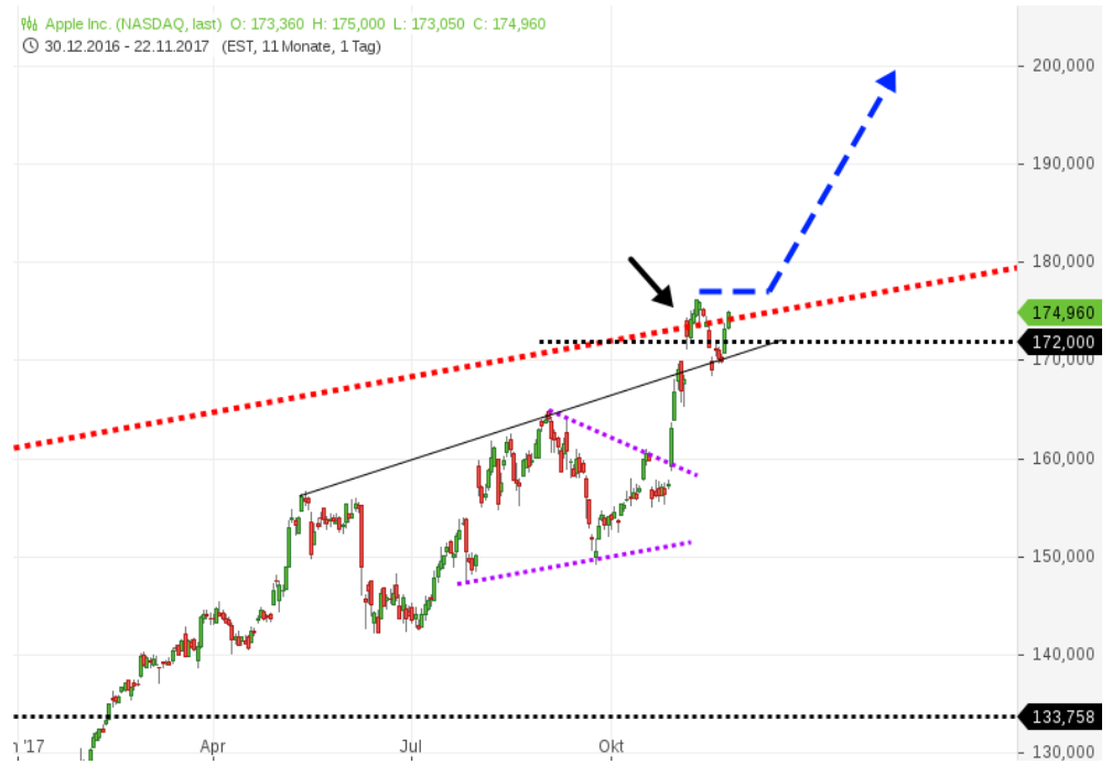
Apple (1 Kerze = 1 Tag)