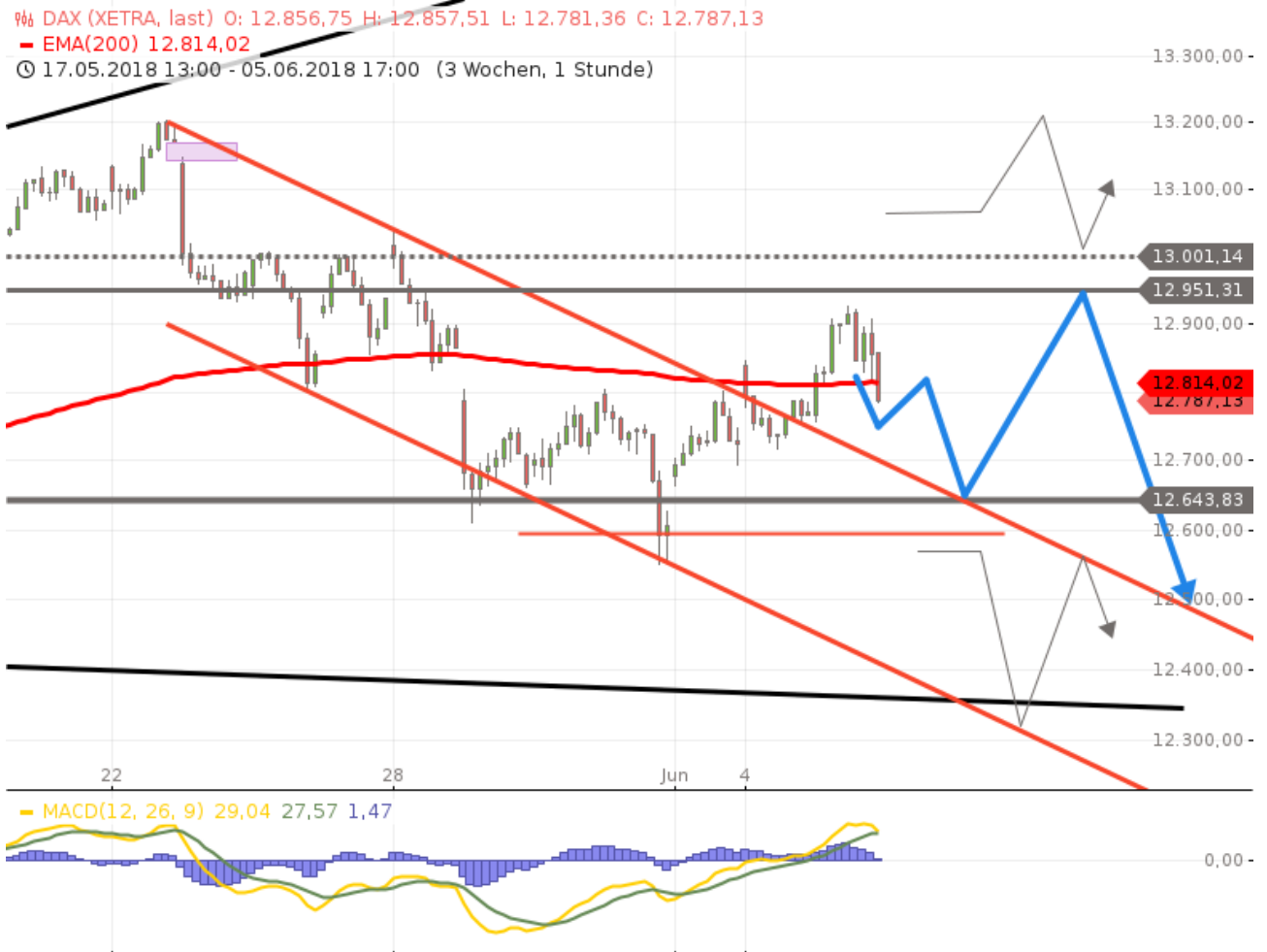
DAX Chartanalyse - Stundenkerzenchart - 1 Kerze = 1 Stunde, XETRA