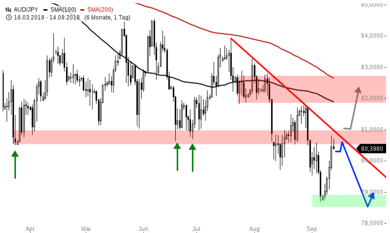
AUD/JPY Chartanalyse (Tageschart)