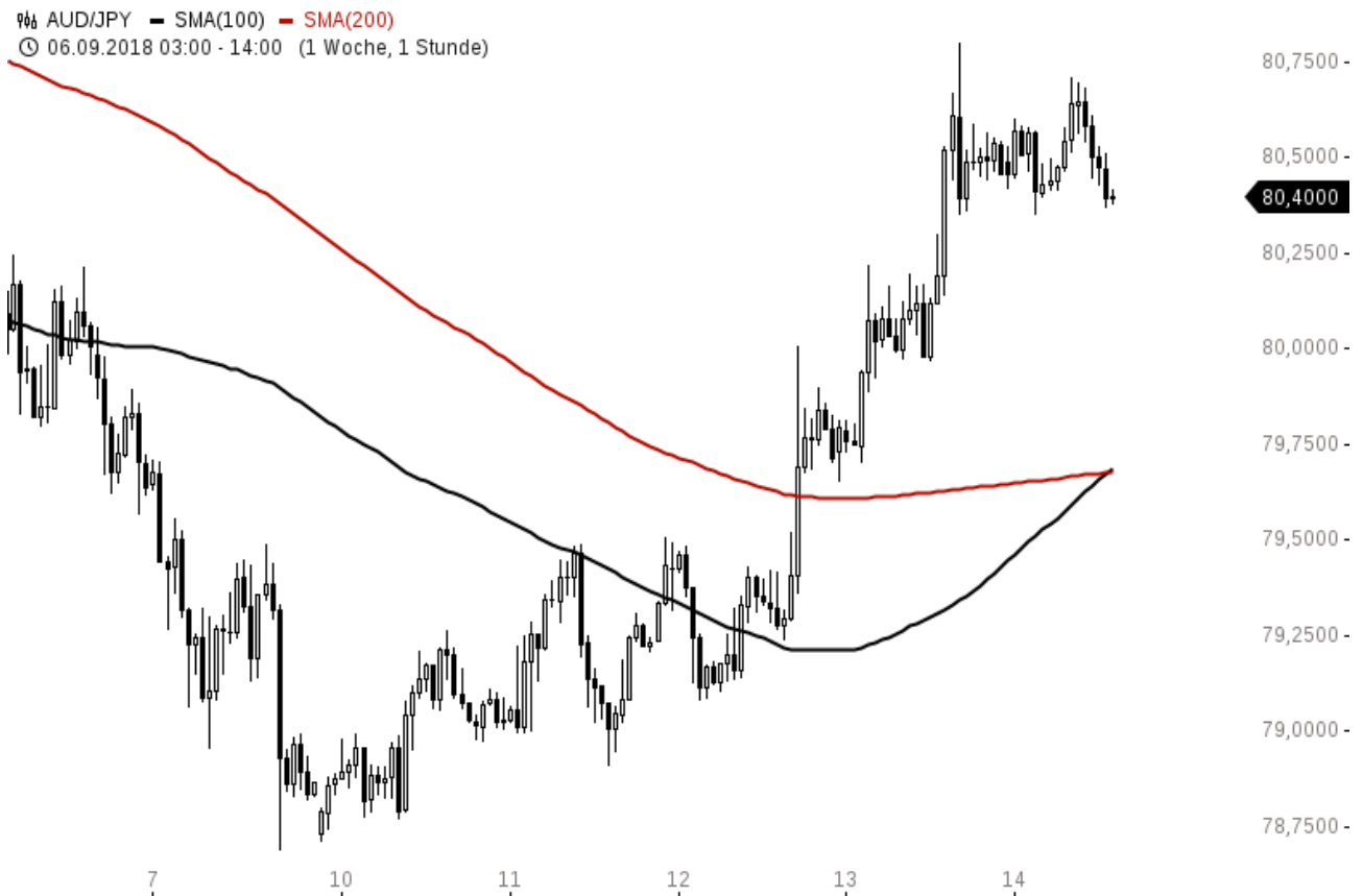
AUD/JPY Chartanalyse (Stundenchart)