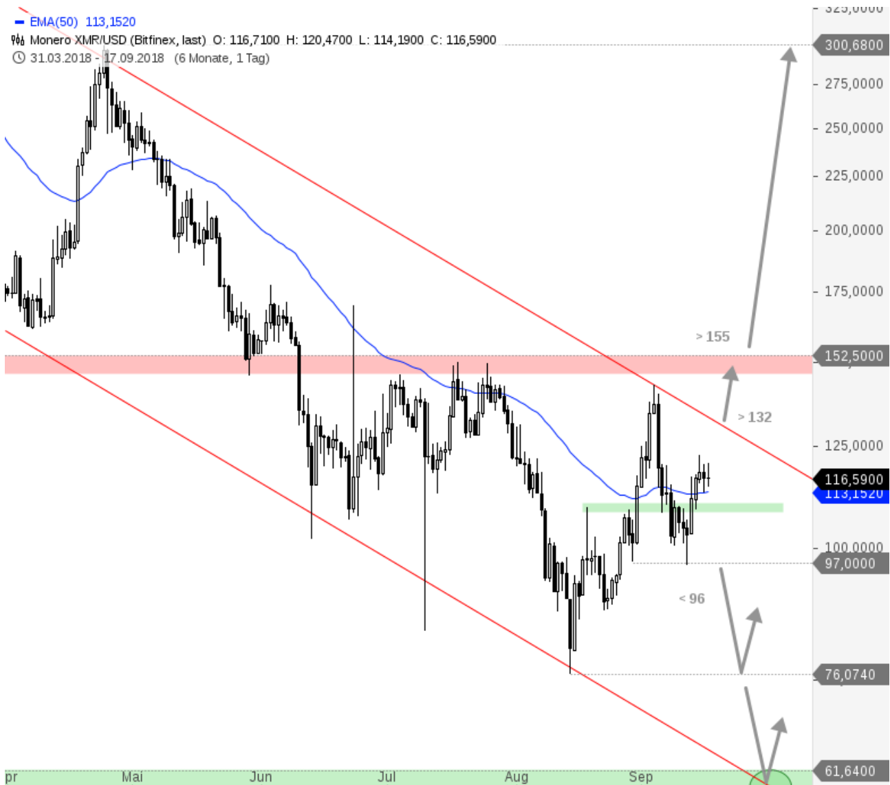
Monero XMR/USD Chartanalyse

Erst bei einem nachhaltigen Ausbruch über 155 USD entstehen größere Kaufsignale, dann könnte eine Aufwärtswelle in Richtung 300 USD ihren Anfang nehmen. Mit einem Rückfall unter 96 USD per Tagesschlusskurs hingegen könnten die Bären wieder Chancen auf Abgaben zum Jahrestief bei 76 USD erhalten.