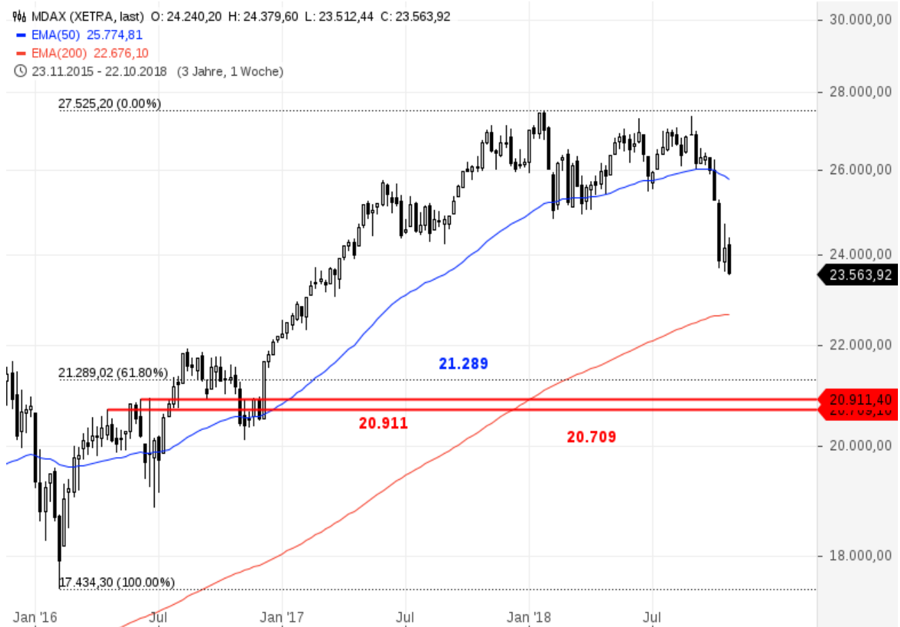
MDAX mit 61,8 %-Fibonacci-Retracement und MoB-Marken

Hält der MDAX diese Marken nicht, dürfte auch dieser Index den Anstieg seit 2016 mit hoher Wahrscheinlichkeit rückabwickeln. Im Monatschart ergeben sich daraus Ziele für ein Baisseszenario bei 17.434 Punkten und im Extremfall bei 14.398 Punkten.