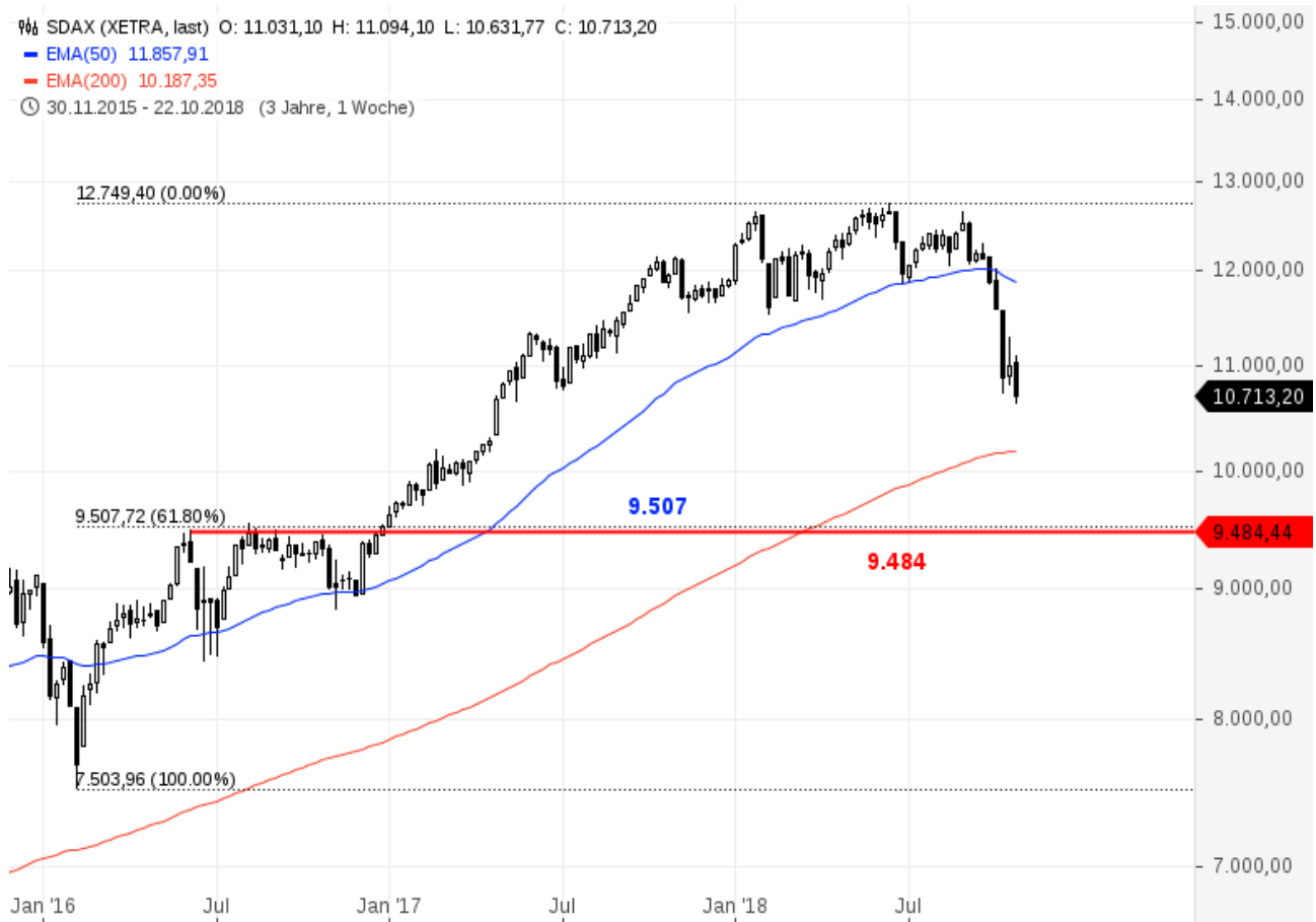
SDAX mit 61,8 %-Fibonacci-Retracement und MoB-Marke

Wird dieser Kampf verloren, lägen Ziele für ein Baisseszenario verglichen mit den anderen Indizes bei gut 7.500 und knapp 6.090 Punkten. Diese Ziele entsprechen den Tiefs vorangegangener Korrekturwellen.