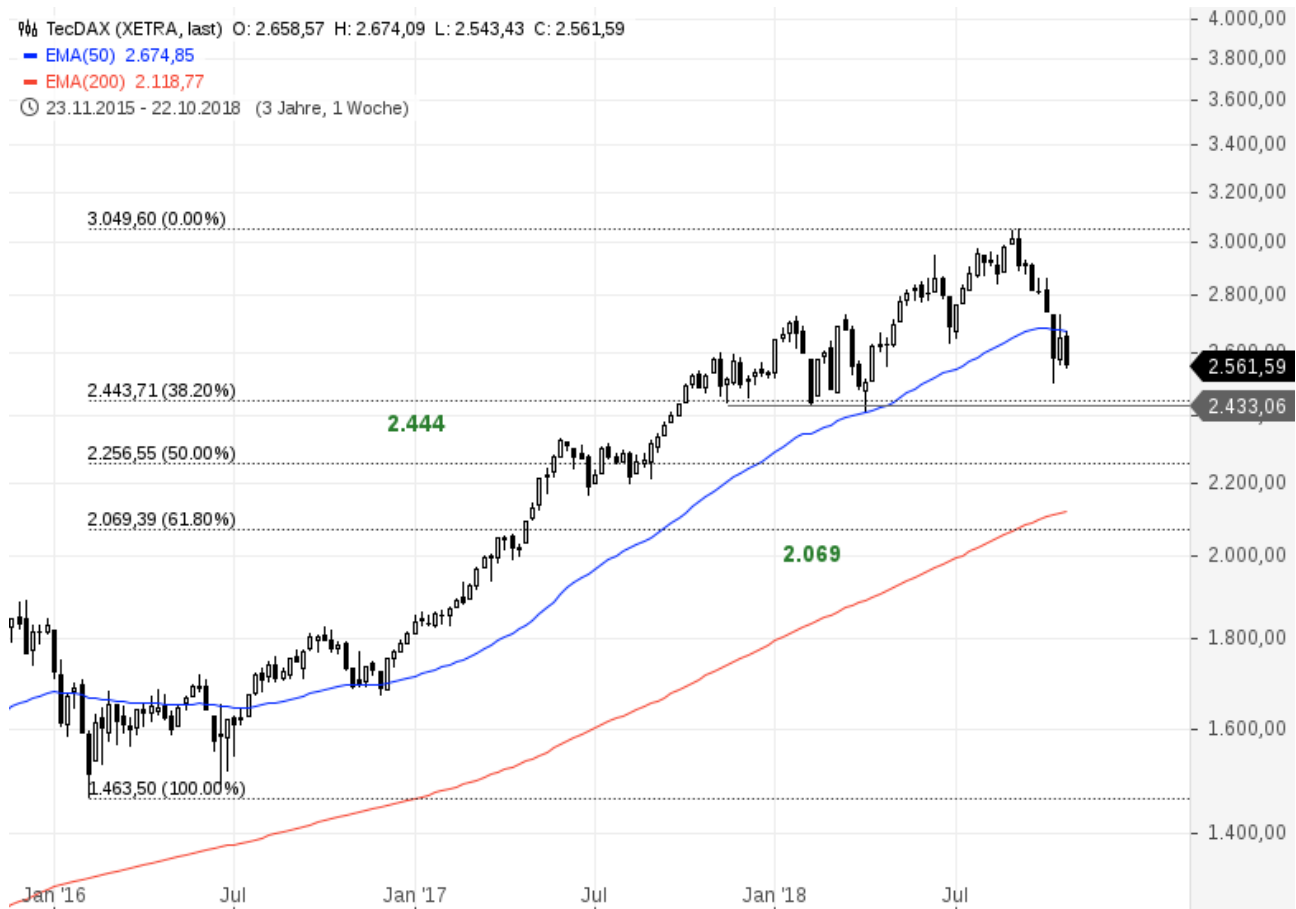
TecDAX mit Fibonacci-Retracements

Im Falle eines erheblichen Baisse-Szenarios und um Parallelen zu den anderen beiden Indizes zu ziehen, müsste der TecDAX sogar auf 1.500 und im Extrem 1.090 Punkte nachgeben. Die Fallhöhe ist dort also enorm. Man kann den Spieß aber auch umdrehen und es so formulieren: Geht man davon aus, dass die Outperformance der Technologietitel anhalten wird, wird es eher schwierig, diese Ziele zu erreichen. Sie stellen jedenfalls rein formal das langfristige Maximalrisiko aus technischer Sicht dar.