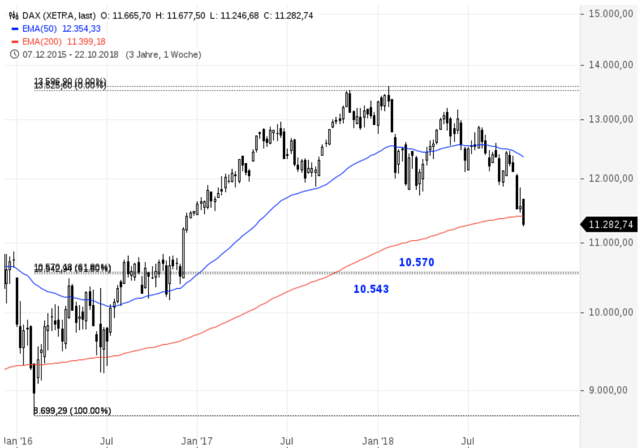
DAX mit 61,8 %-Fibonacci-Retracement

Nimmt man die Elliott-Wellen einmal außen vor, könnte man auch mit den Fibonacci-Retracements arbeiten, um zu bestimmen, ob der aktuelle Downmove nur eine Konsolidierung auf den Anstieg seit 2016 darstellt oder mehr daraus wird.