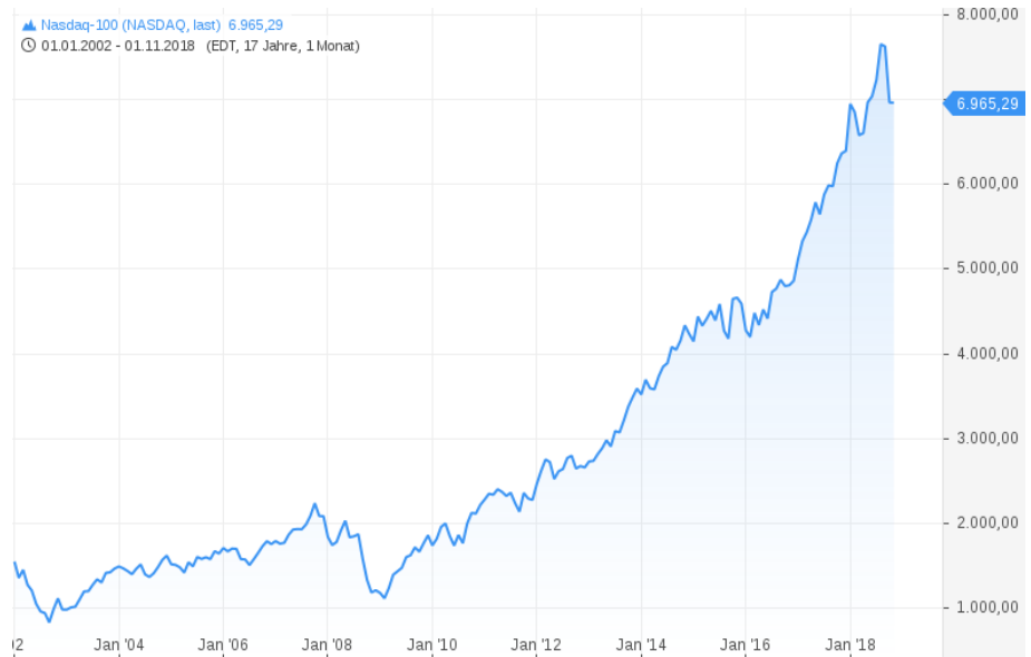
Nasdaq-100 / langfristig