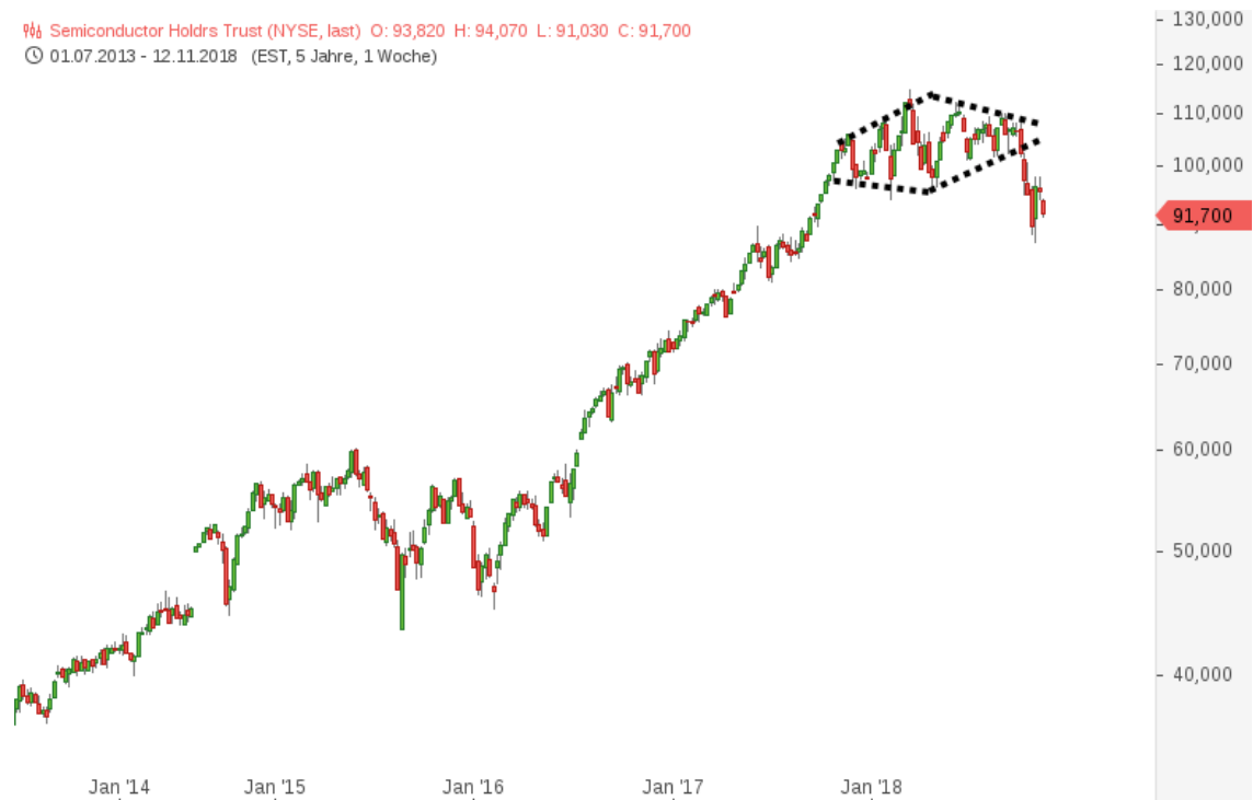
Semiconductor Holdrs Trust

📈 Semiconductor Holdrs Trust (NYSE, last) O: 93,820 H: 94,070 L: 91,030 C: 91,700 🕒 01.07.2013 - 12.11.2018 (EST, 5 Jahre, 1 Woche)