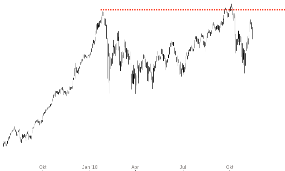
Dow Jones Industrial Average

28.000,00 - 27.000,00 - 26.700,00 - 26.000,00 - 25.468,18 - 25.000,00 - 24.000,00 - 23.000,00 - 22.000,00 - 21.000,00 -