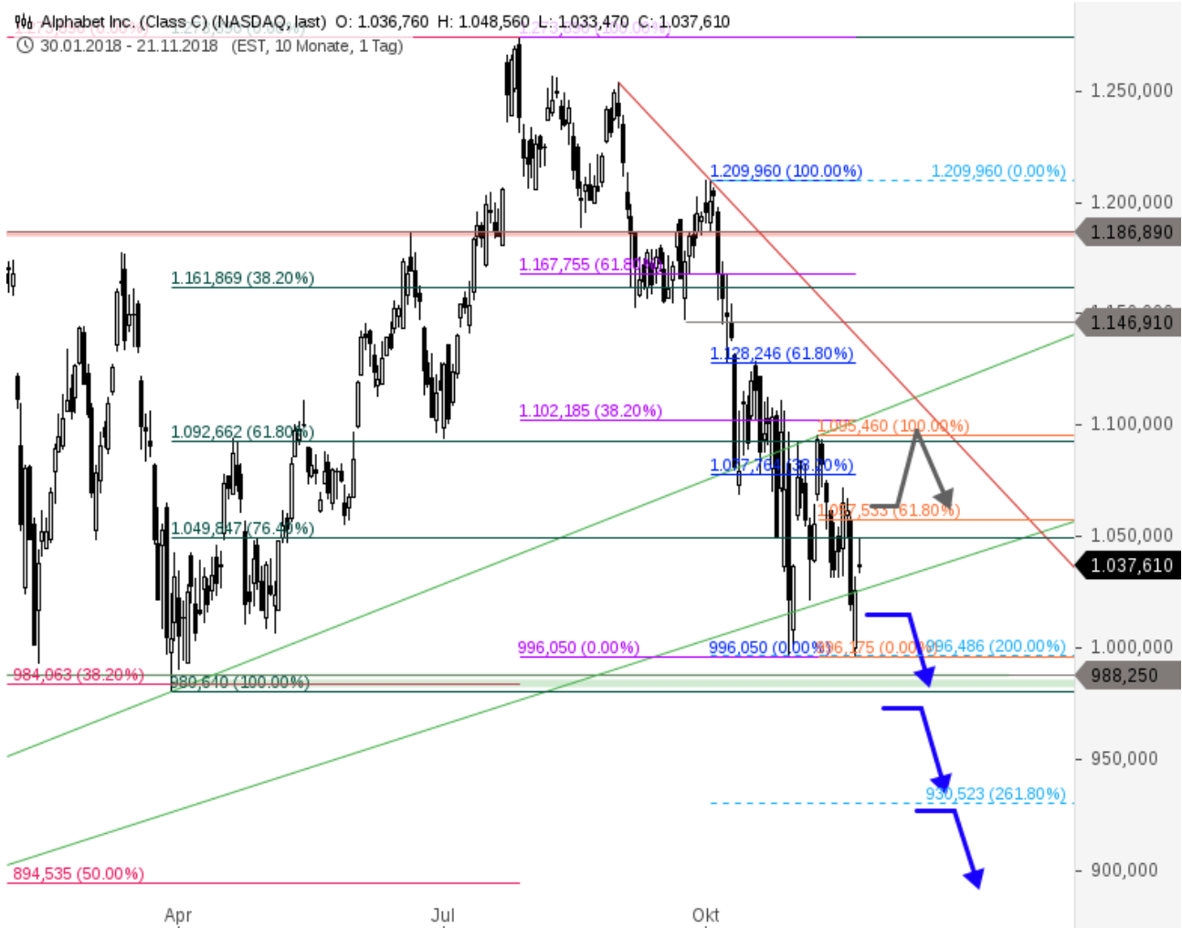
Alphabet Inc. (Class C) Chartanalyse (Tageschart)