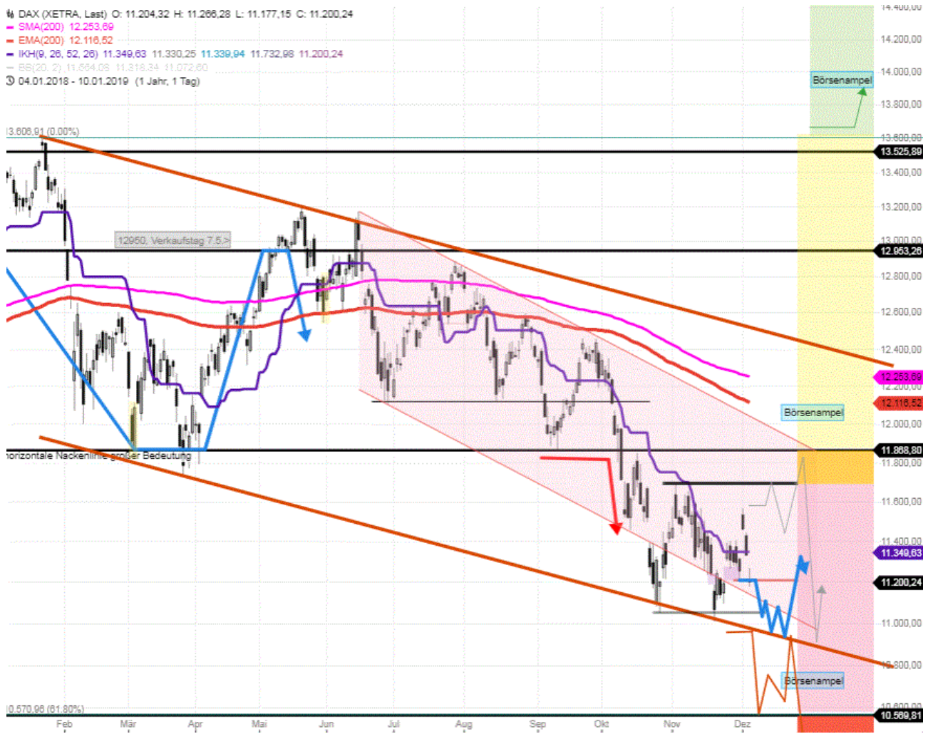
Tageskerzenchart seit September 2018