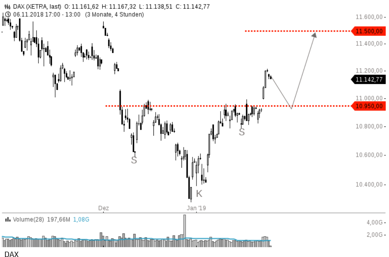
Chart2: Ein Ziel bei 11.500 würde bedeuten, dass sie diese rot gestrichelt dargestellte mittelfristige Widerstandslinie bei 11.250 Punkten nach oben knacken.

Dow Jones. Ich habe alles außer der im aktuellen Marktgeschehen entscheidenden Hürde bei 24.290 ausgeblendet. Bei der Hürde handelt es sich um die Nackenlinie einer relativ angeordneten Doppeltopformationen, die sich seit Ende Oktober 2018 ausgebildet hat.