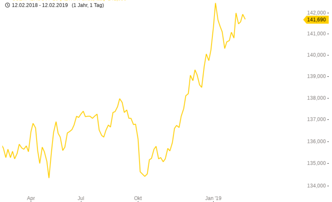
iShares $ Treasury Bond 7-10yr UCITS ETF USD (Acc)

— CSETF IBXSGV7-10 (XETRA Funds, last) 141,690 © 12.02.2018 - 12.02.2019 (1 Jahr, 1 Tag)