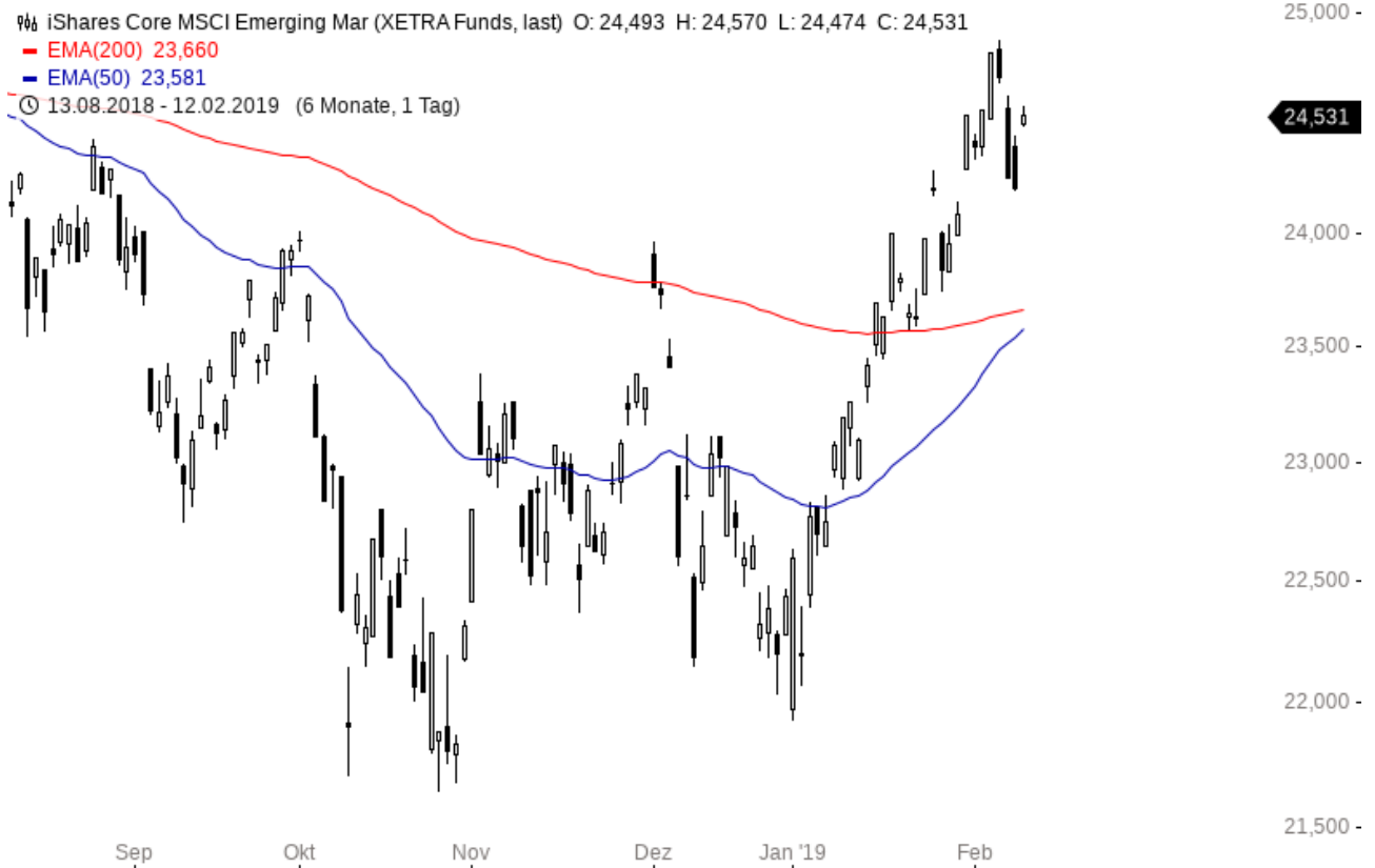
iShares Core MSCI EM IMI UCITS ETF

Der zweitpopulärste Trade nach Einschätzung der Fondsmanager sind aktuell Long-Positionen auf den US-Dollar. Der folgende Chart zeigt, dass der US-Dollar bereits seit Februar 2018 gegenüber den wichtigsten anderen Währungen deutlich zulegen konnte.