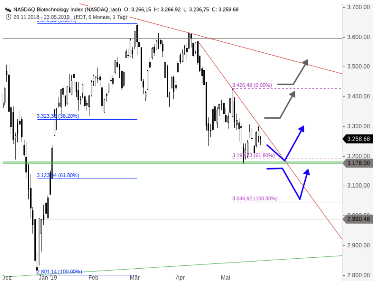
Nasdaq Biotech Index Chartanalyse (Tageschart)

Damit wäre egal, ob der Index anschließend als Performance-Nachzügler vom starken Gesamtmarkt wieder nach Norden gezogen würde, oder als technischer Frontrunner jetzt schon einen Boden ausbildet und der breite Markt in wenigen Tagen bzw. Wochen folgt. Alles andere als egal wäre dagegen ein dynamischer Bruch der 3.178 Punkte-Marke. Dieses Kursniveau sollte man auch in Hinblick auf weiteres Rückschlagspotenzial im S&P 500 im Auge behalten.