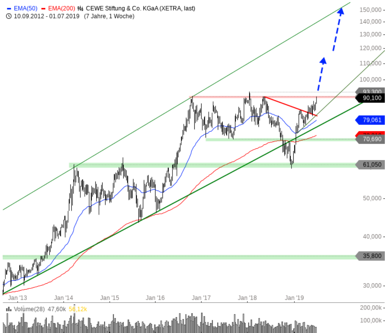
CEWE Stiftung Co KGaA Aktie Wochenchart