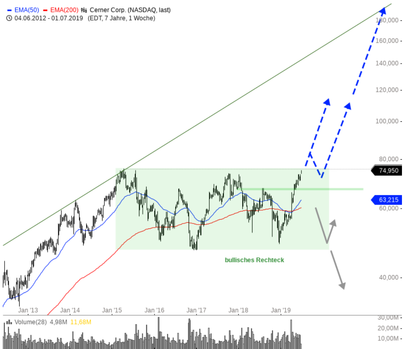
Cerner Corp Wochenchart

EMA(50) EMA(200) Cerner Corp. (NASDAQ, last) © 04.06.2012 - 01.07.2019 (EDT, 7 Jahre, 1 Woche)