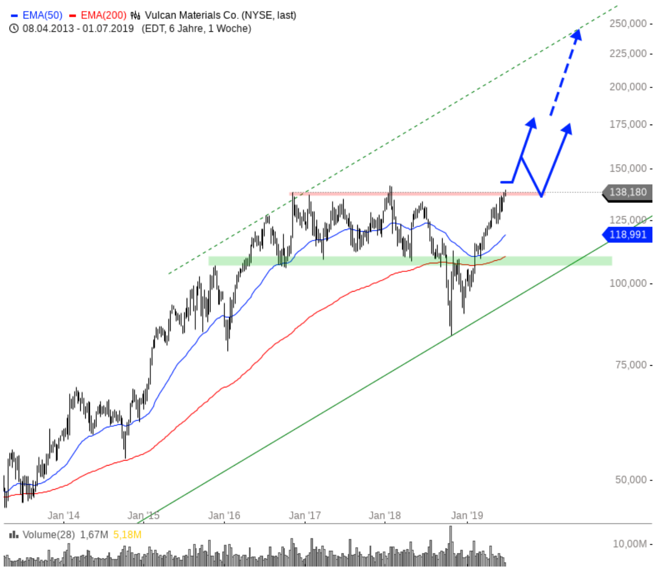
Vulcan Materials Co Aktie

— EMA(50) — EMA(200) % Vulcan Materials Co. (NYSE, last) © 08.04.2013 - 01.07.2019 (EDT, 6 Jahre, 1 Woche)