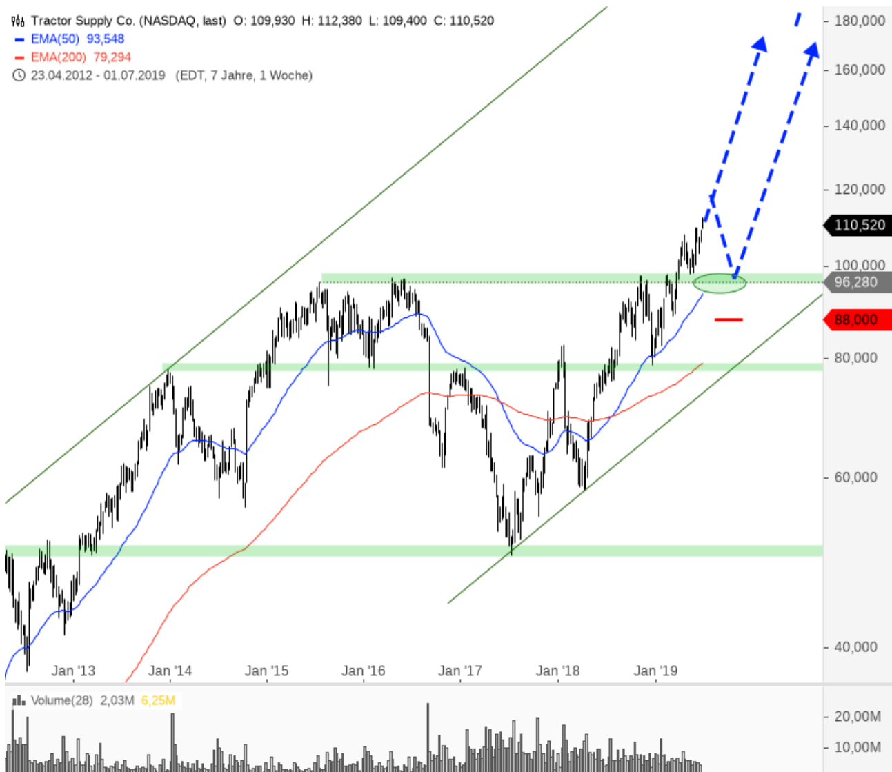
Tractor Supply Co. weekly

Tractor Supply Co. (NASDAQ, last) O: 109,930 H: 112,380 L: 109,400 C: 110,520 - EMA(50) 93,548 - EMA(200) 79,294 23.04.2012 - 01.07.2019 (EDT, 7 Jahre, 1 Woche)