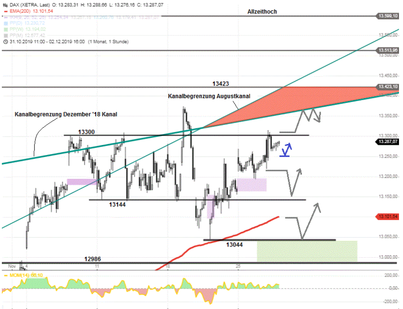
XETRA DAX Stundenkerzenchart mit "Wolke"