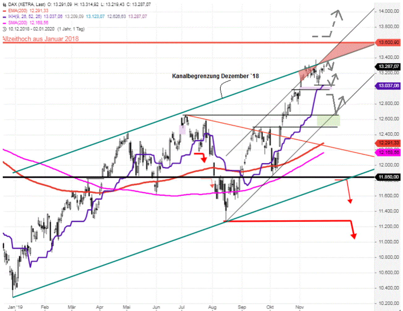
FDAX Stundenkerzenchart mit Nachthandel seit 1:15 Uhr: