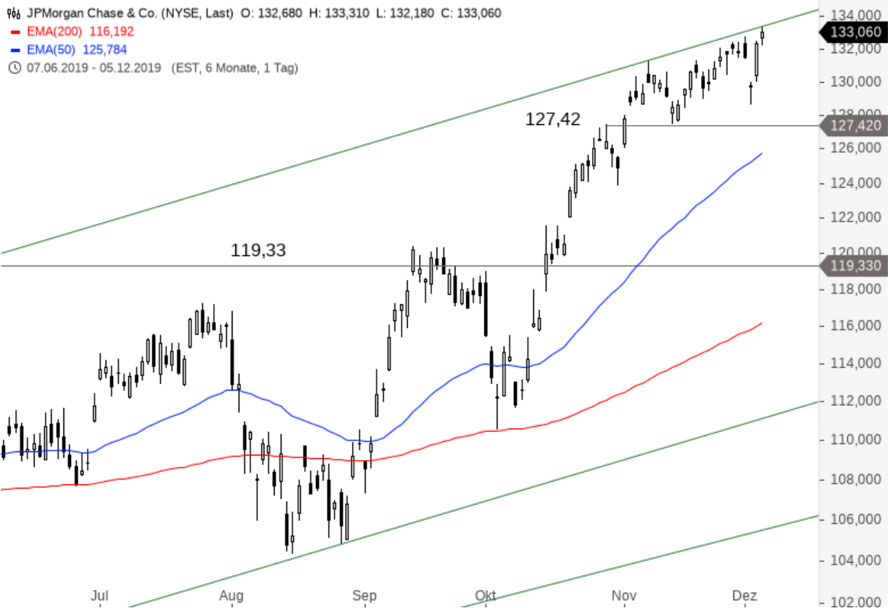
JPMorgan Chase & Co.