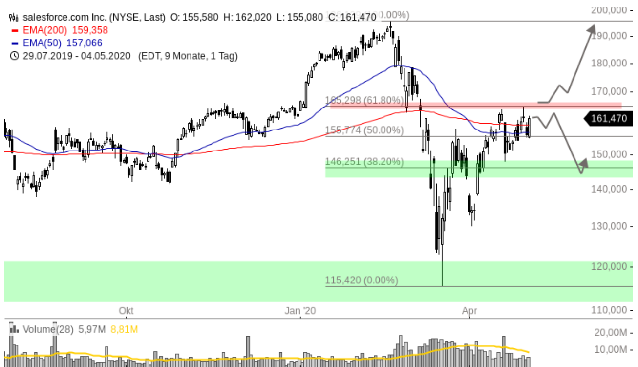
salesforce.com Aktie (Chartanalyse Tageschart)

Live-Trading oder Ausbildung? DAX oder Dow Jones? Handeln mit Anleitung oder auf eigene Faust? Im Trading-Service „CCB – Centre Court Börse“ bekommen Sie alles – und noch viel mehr. Jetzt CCB – Centre Court Börse abonnieren