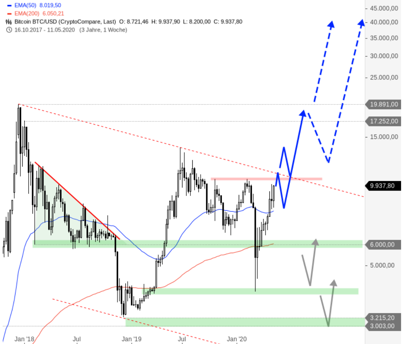
BTC/USD Bitcoin Chart weekly