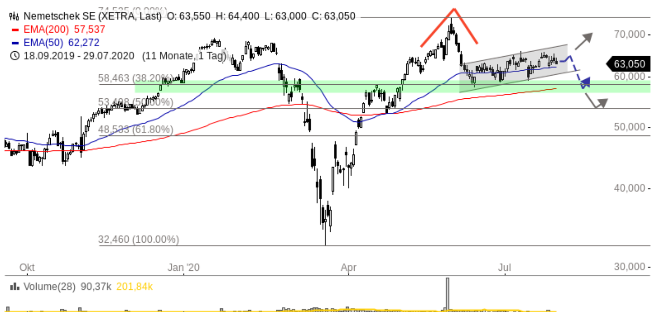
Nemetschek Aktie (Chartanalyse Tageschart)

Tipp: Als Godmode PLUS –Kunde sollten Sie auch Guidants PROmax testen. Es gibt dort tägliche Tradinganregungen, direkten Austausch mit unseren Börsen-Experten in einem speziellen Stream, den Aktien-Screener und Godmode PLUS inclusive. Analysen aus Godmode PLUS werden auch als Basis für Trades in den drei Musterdepots genutzt. Jetzt das neue PROmax abonnieren!