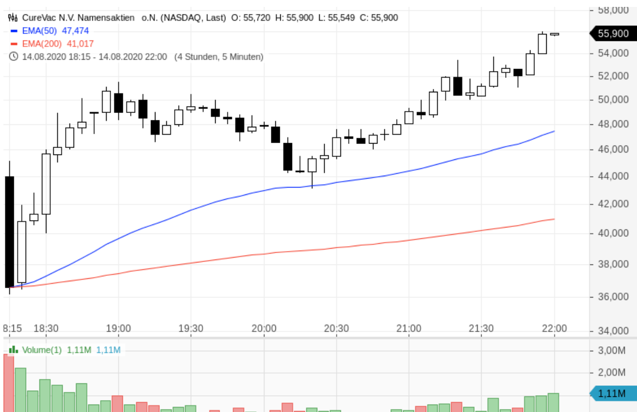
CureVac-Aktie im Intraday-Chart

Update: CureVac beendete den ersten Handelstag an der Nasdaq mit einem Kurs von 55,90 Dollar. Das lag 27,05 Prozent über dem ersten Kurs von 44,00 Dollar und ganze 249,38 Prozent über dem Ausgabepreis von 16 Dollar.