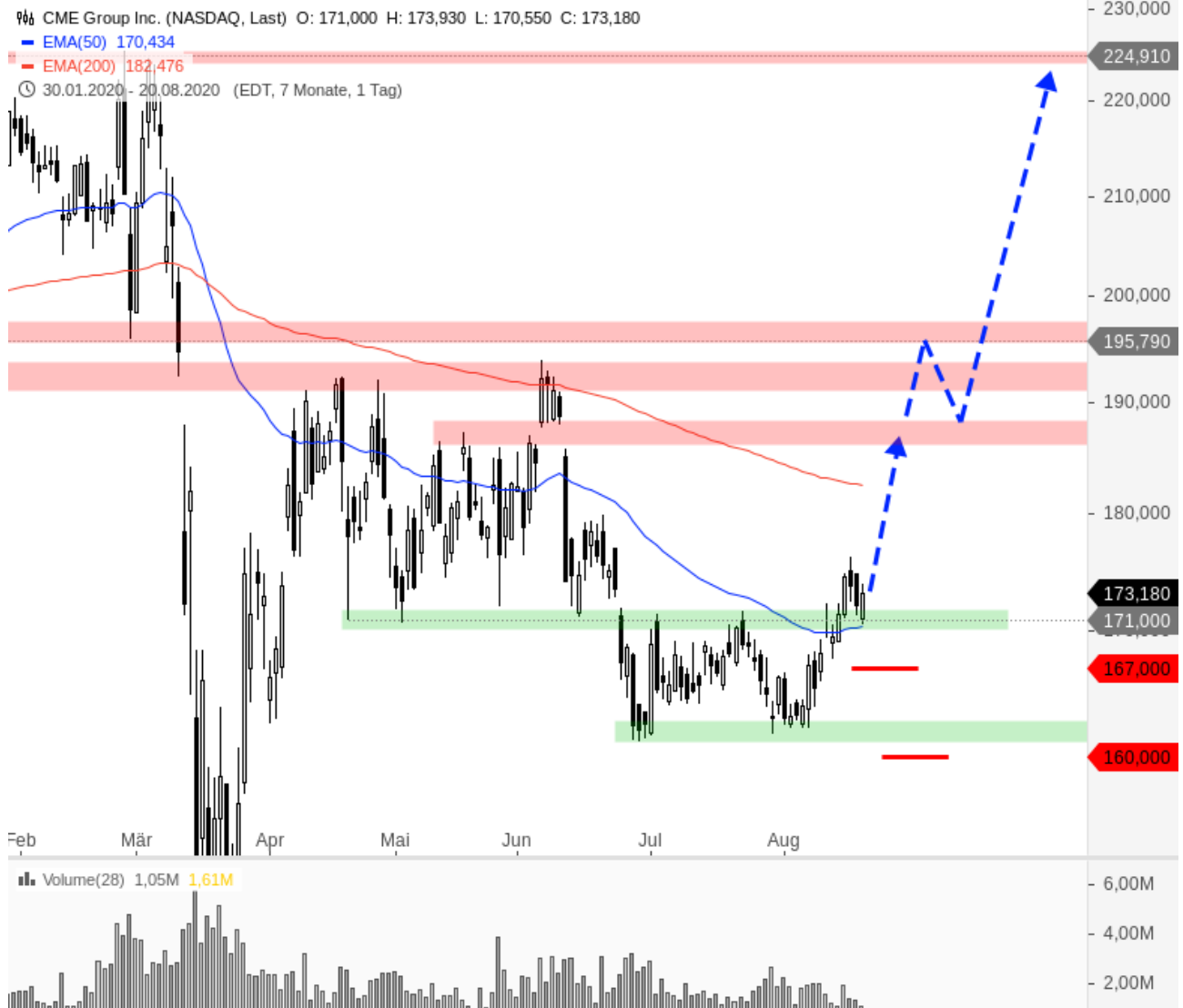
CME Group Inc.