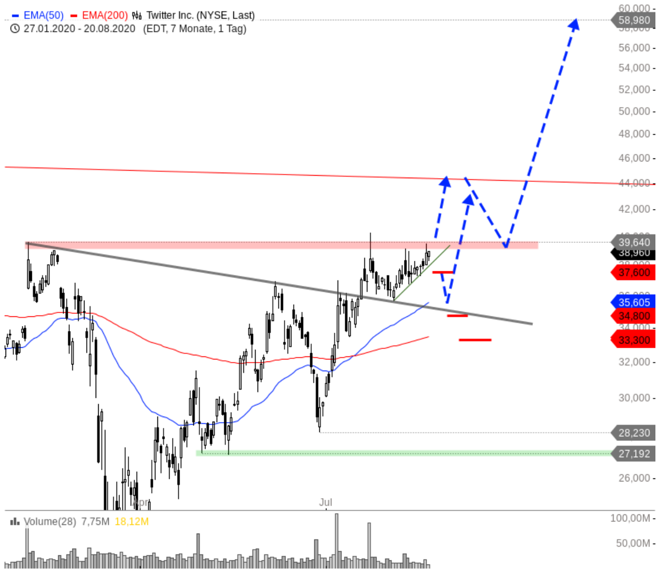
Twitter Inc Chartanalyse