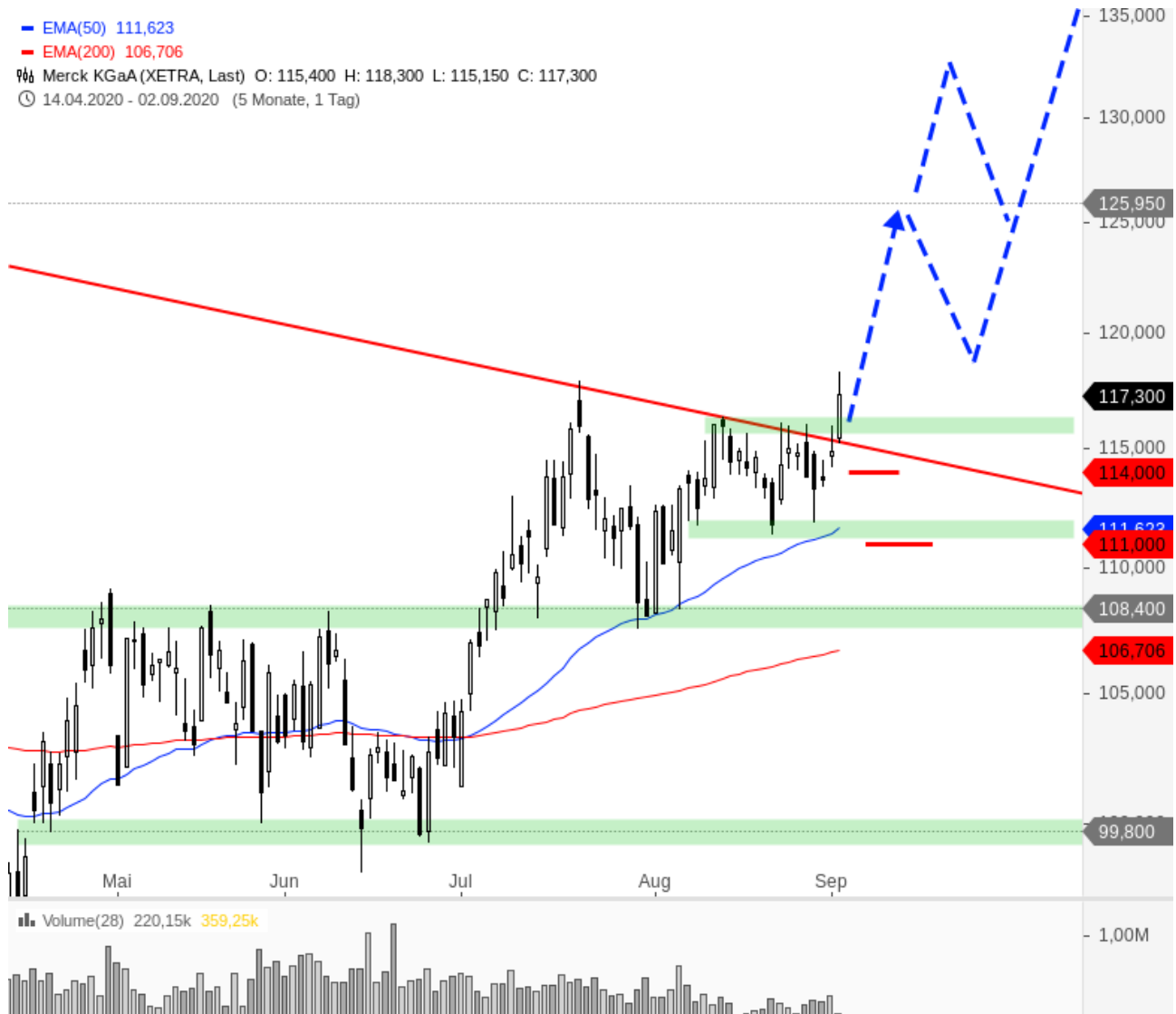
Merck KGaA - Aktie