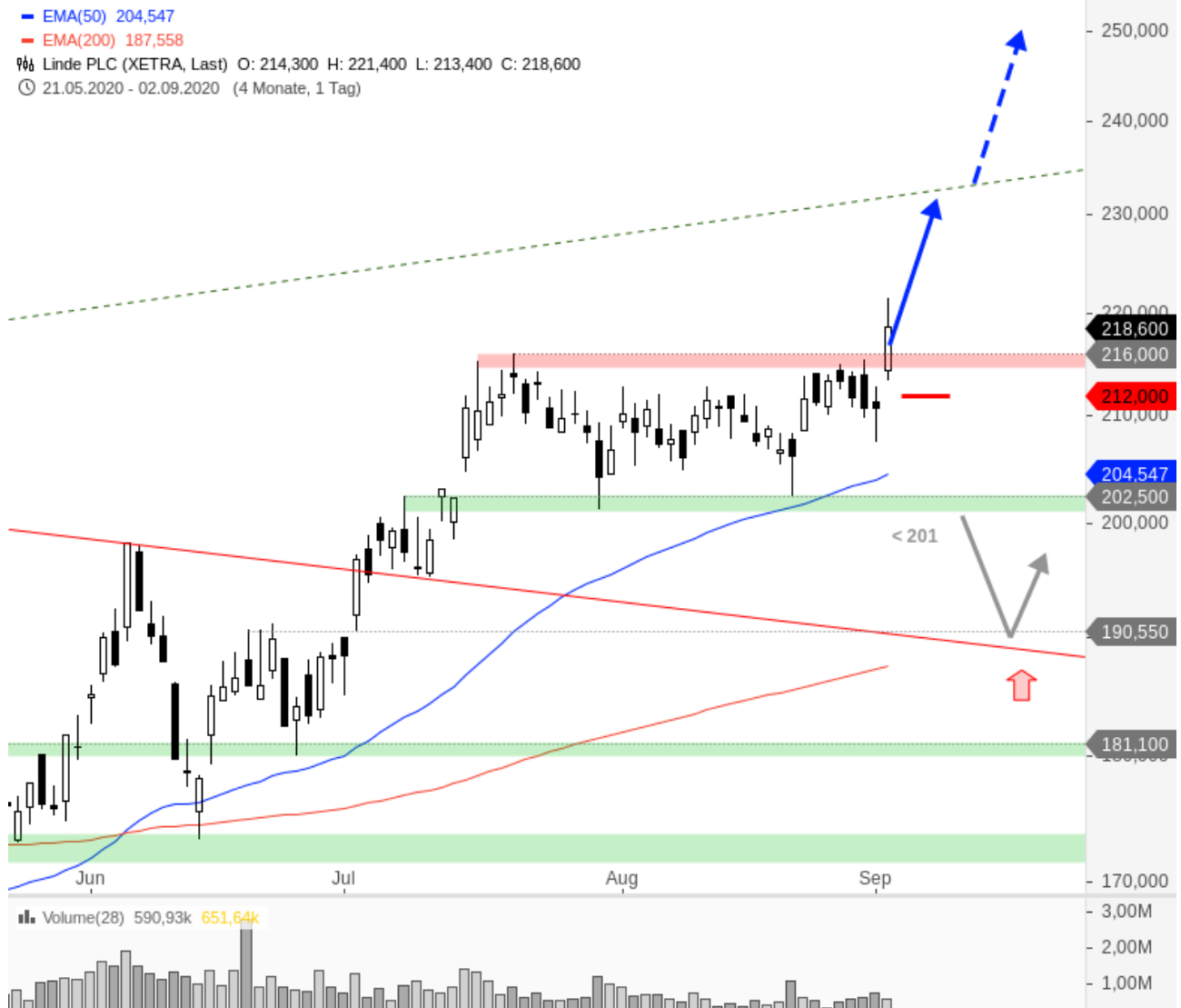
Linde PLC Aktie