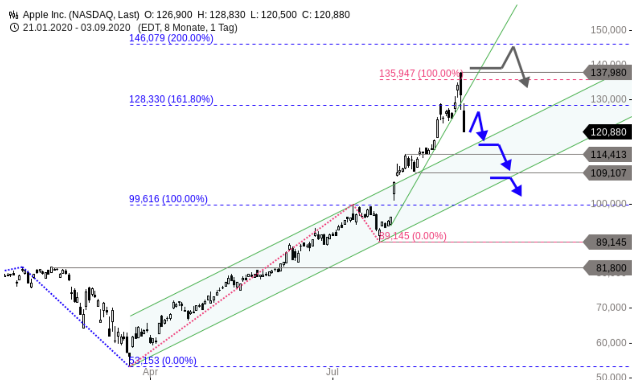
Apple Inc. Chartanalyse (Tageschart)

📈 Apple Inc. (NASDAQ, Last) O: 126,900 H: 128,830 L: 120,500 C: 120,880 ⌚ 21.01.2020 - 03.09.2020 (EDT, 8 Monate, 1 Tag) 146,079 (200.00%)