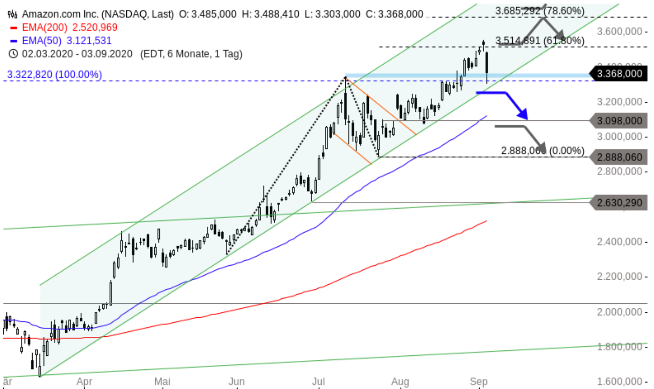
Amazon Chartanalyse (Tageschart)