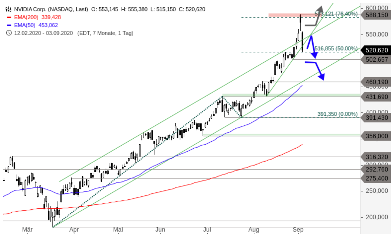
NVIDIA Chartanalyse (Tageschart)

📈 NVIDIA Corp. (NASDAQ, Last) O: 553,145 H: 555,380 L: 515,150 C: 520,620 — EMA(200) 339,428 — EMA(50) 453,062 🕒 12.02.2020 - 03.09.2020 (EDT, 7 Monate, 1 Tag)