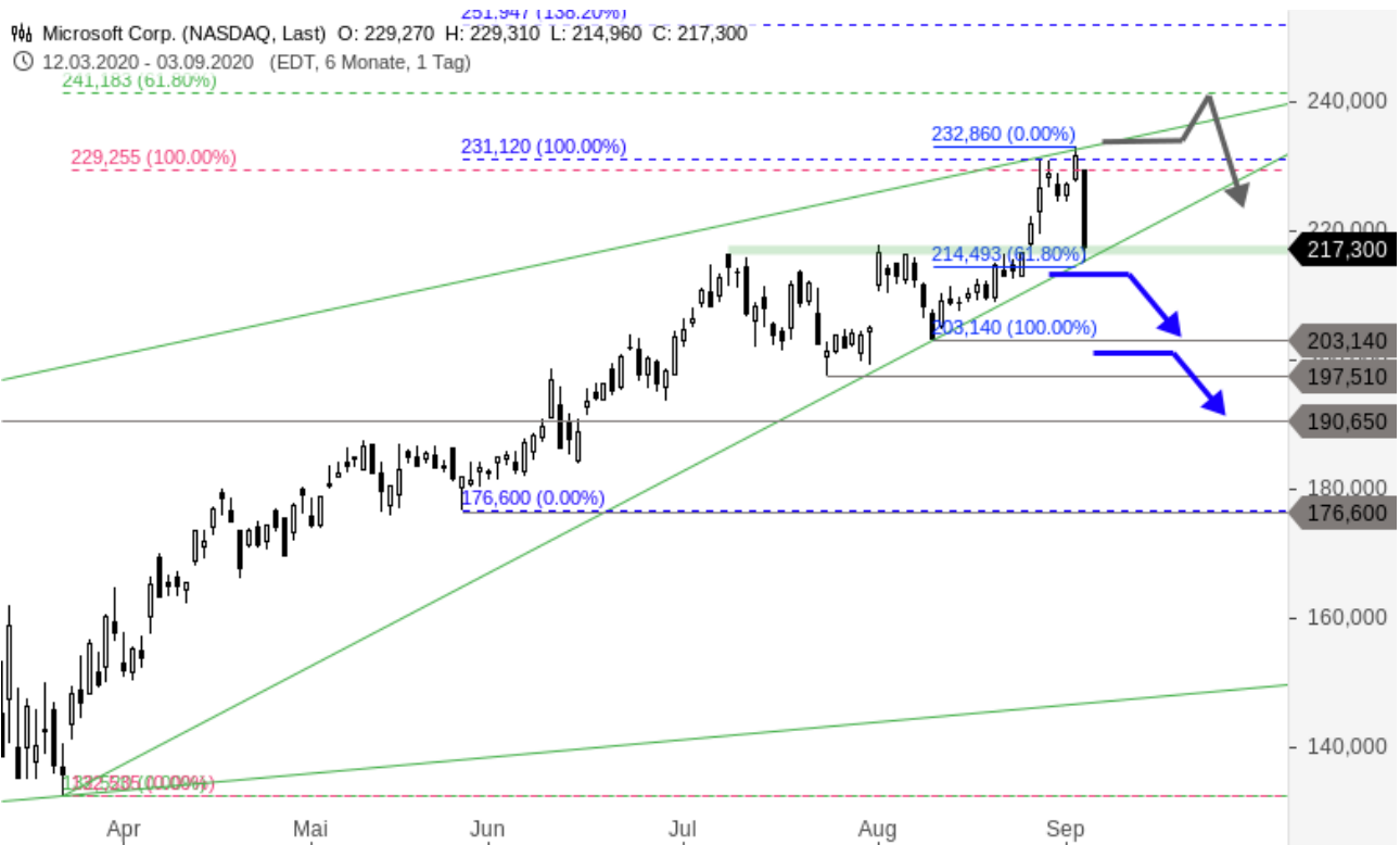
Microsoft Chartanalyse (Tageschart)

Besuchen Sie mich auch auf Guidants , werden Sie Follower und erhalten Sie weitere Analysen zu Edelmetallen, Aktien und den großen Indizes.