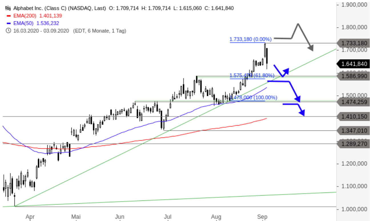
Alphabet Chartanalyse (Tageschart)

🕒 16.03.2020 - 03.09.2020 (EDT, 6 Monate, 1 Tag)