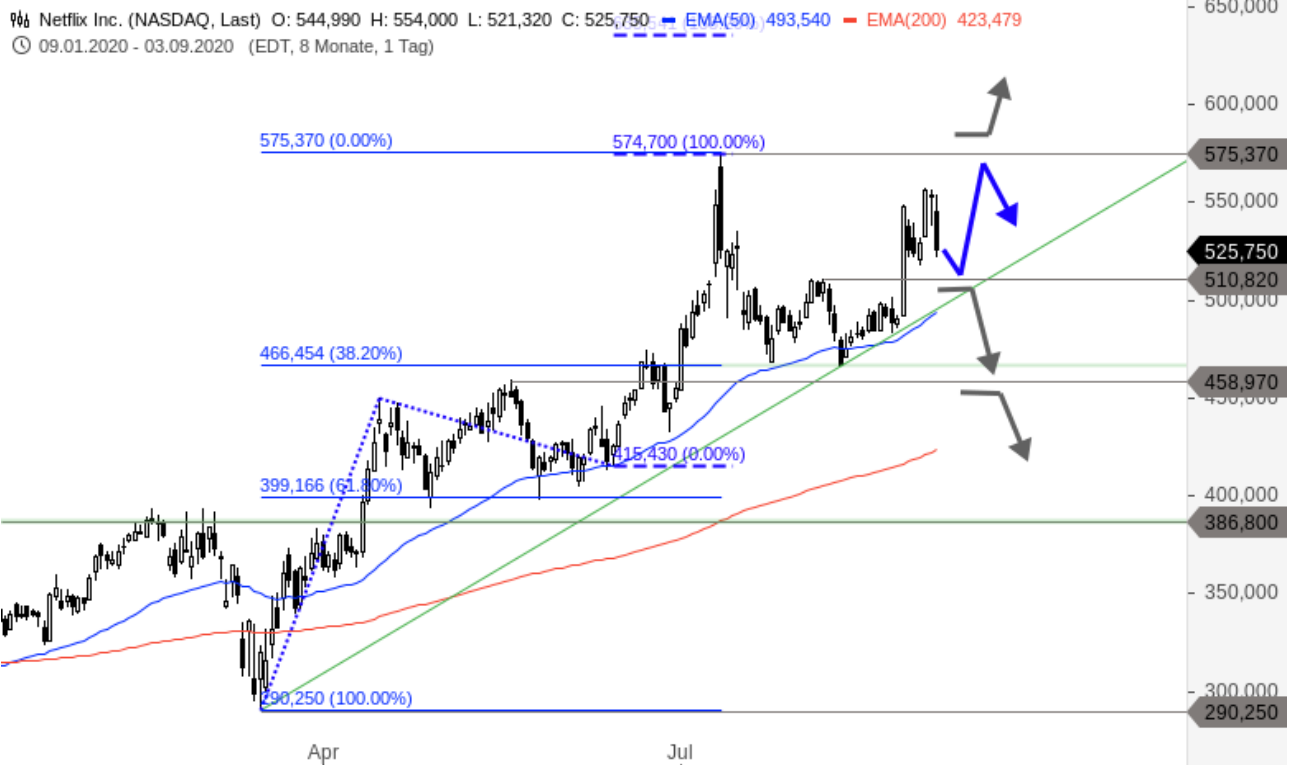
Netflix Chartanalyse (Tageschart)