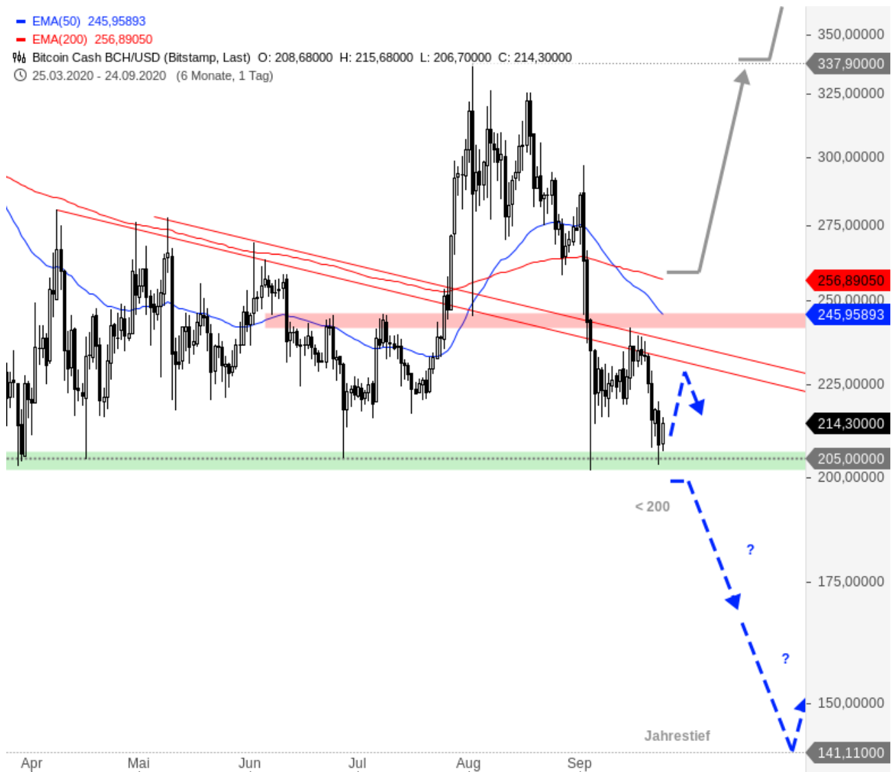
Bitcoin Cash BCC/USD