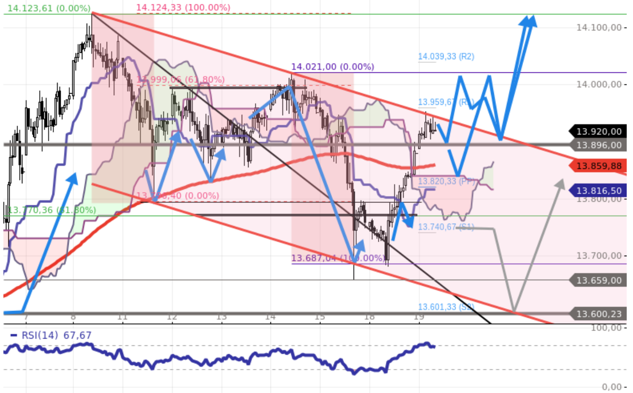
FDAX STUNDENKERZENCHART, interaktiv/ Guidants