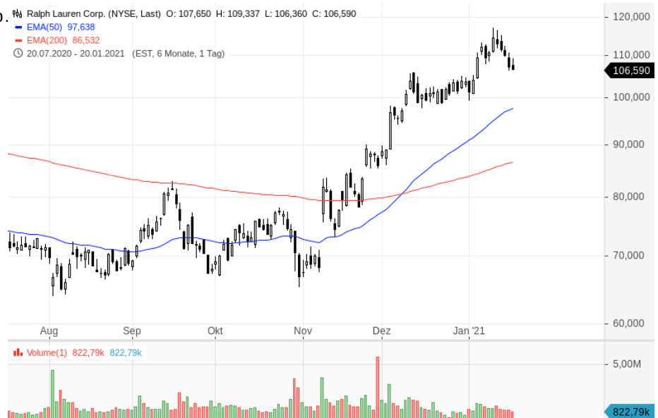
Aktien von Ralph Lauren Corp.