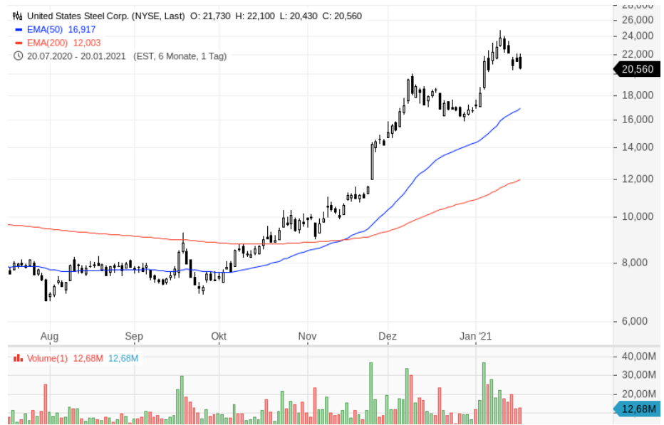
Aktien von US Steel