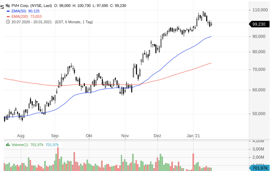
Aktien von PVH Corp.