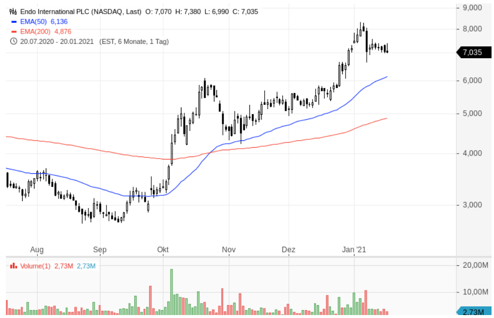
Aktien von Endo International PLC