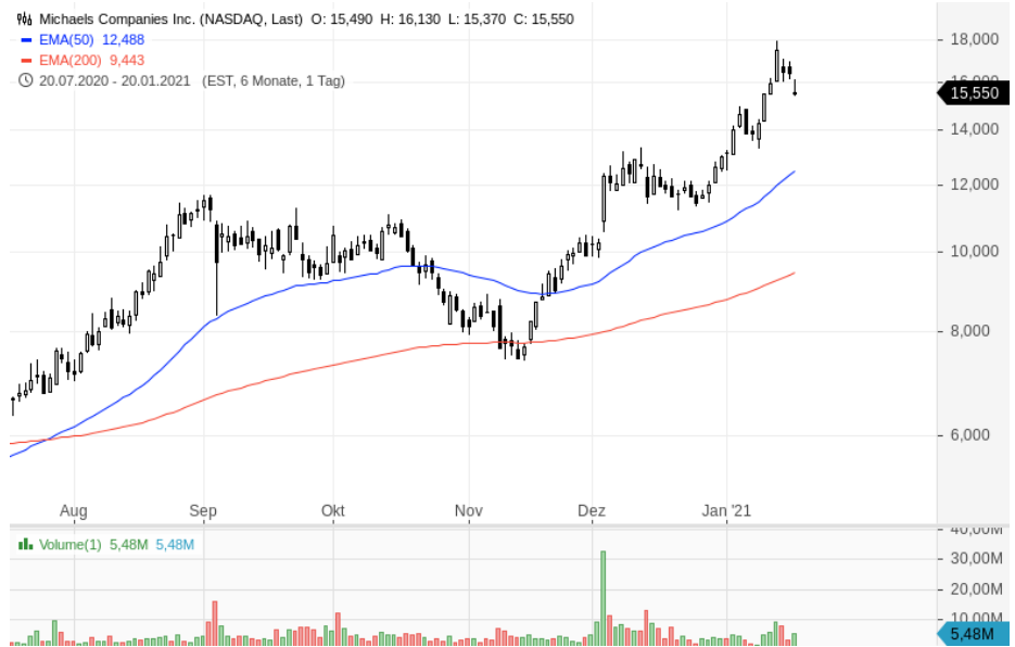
Aktien von Michaels Companies