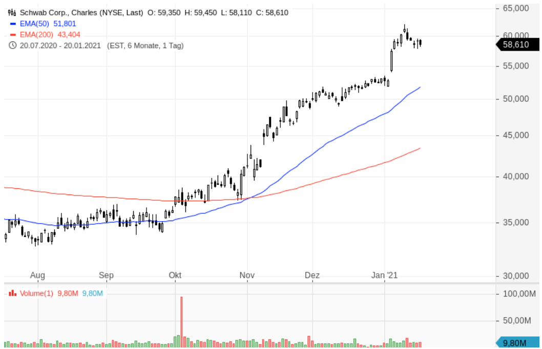
Aktien von Charles Schwab Corp.