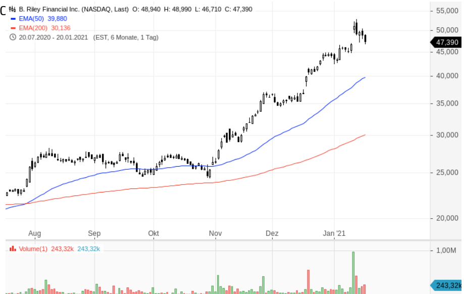
Aktien von B. Riley Financial Inc.