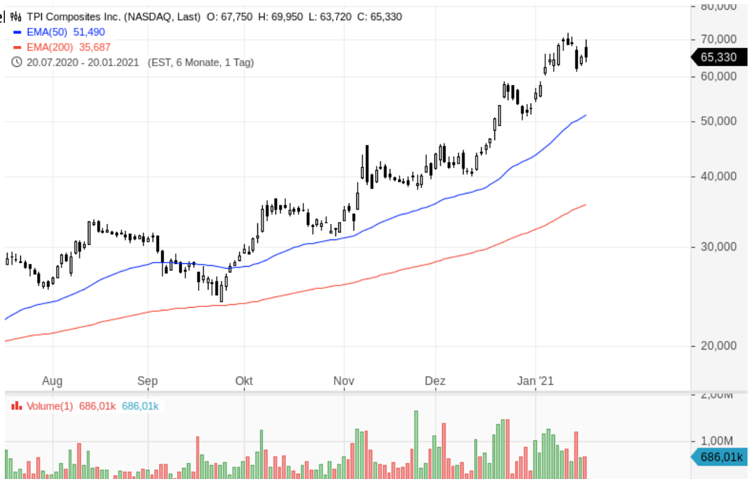
Aktien von TPI Composites