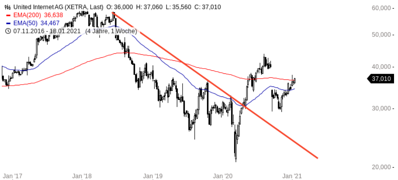
United Internet Aktie (Chartanalyse Wochenchart)

Innerhalb des Bärenmarktes seit Anfang 2018 hat sich der Aktienkurs des Unternehmens zwischenzeitlich annähernd gedrittelt. Mittlerweile hat sich das Chartbild allerdings schon wieder deutlich aufgehellt, auch der Abwärtstrend im Wochenchart wurde zurück erobert und nachhaltig überwunden. Ist das die Trendwende?