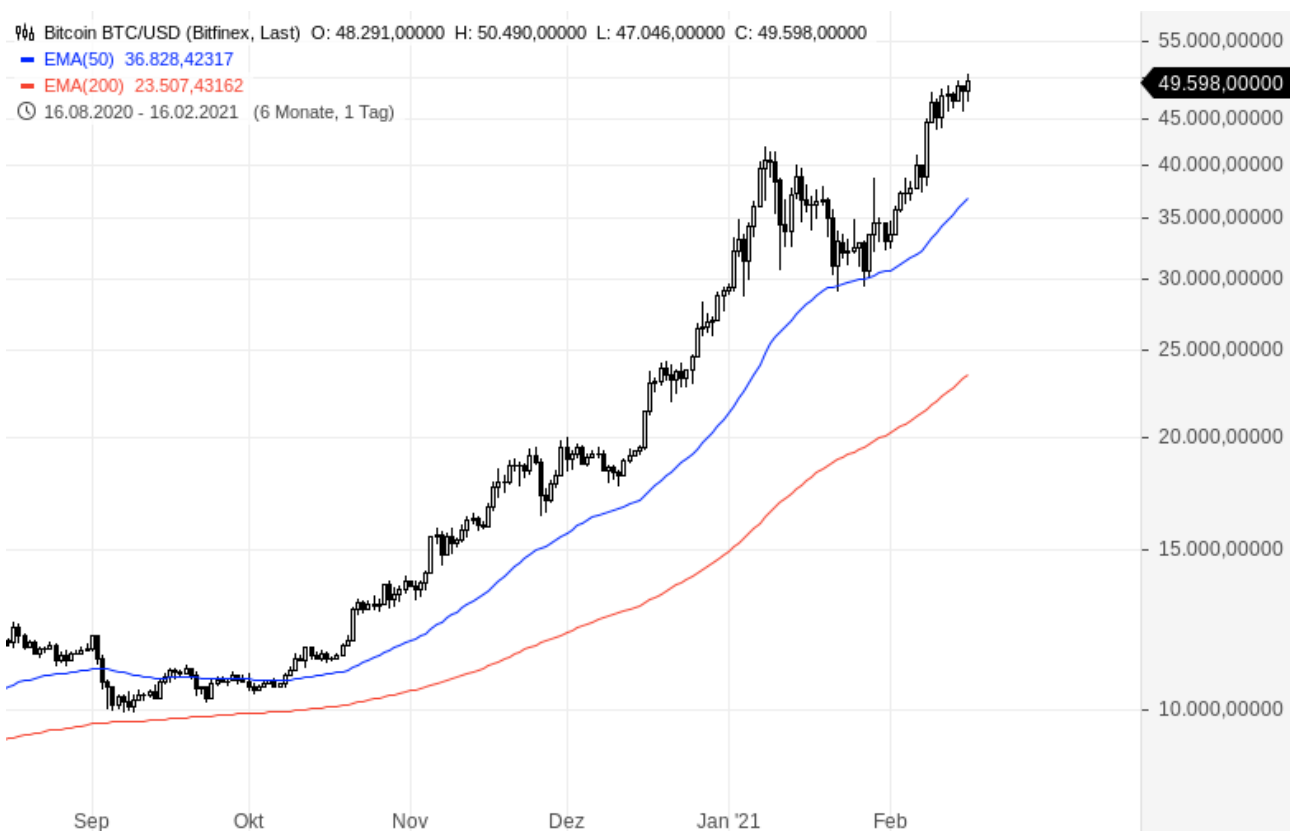
Bitcoin in US-Dollar (BTC/USD)

Die Kursrally der Kryptowährung Bitcoin setzt sich fort. Am Dienstag erreichte der Bitcoin abermals ein neues Rekordhoch und übersprang erstmals die Marke von 50.000 Dollar. Das Kursplus seit Jahresbeginn beträgt bereits mehr als 70 Prozent.