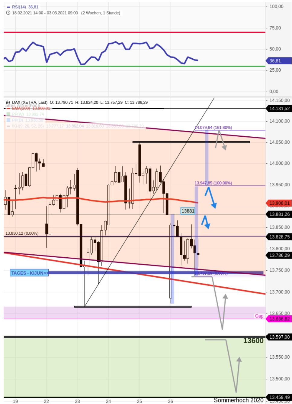
Dax 60 Xetra

Beim traderscamp gehen Trading-Spaß, Spiel und Ausbildung Hand in Hand. In Webinaren, Livestreams und Erklärvideos erhalten Sie nicht nur unerlässliches Grundwissen, sondern lernen auch, Ihre eigenen Handelsstrategien zu entwickeln. Mehr Informationen zum traderscamp 2021