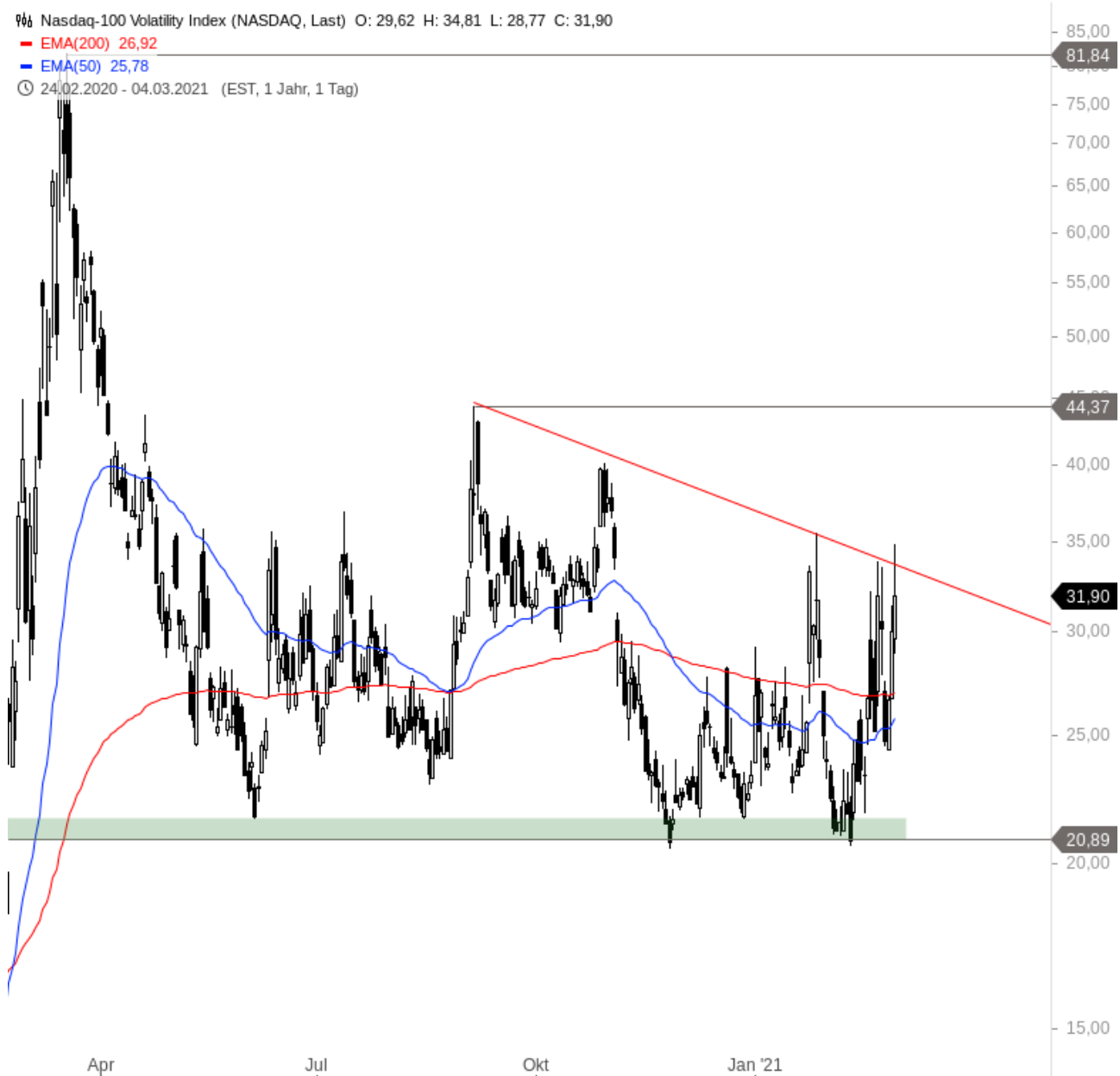
Nasdaq-100 Volatility Index

🕒 24.02.2020 - 04.03.2021 (EST, 1 Jahr, 1 Tag)