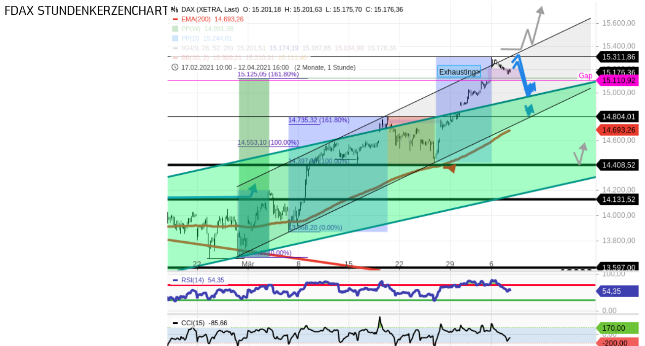
Dax 60 Xetra