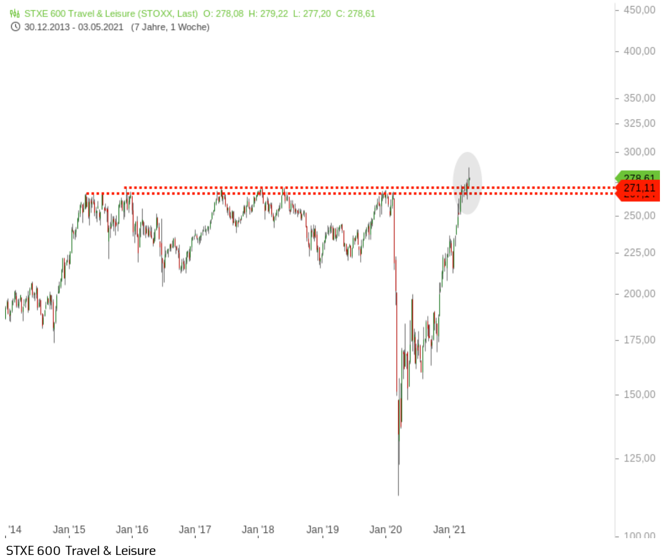
STXE 600 Travel & Leisure

STXE 600 Travel & Leisure (STOXX, Last) O: 278,08 H: 279,22 L: 277,20 C: 278,61 30.12.2013 - 03.05.2021 (7 Jahre, 1 Woche)